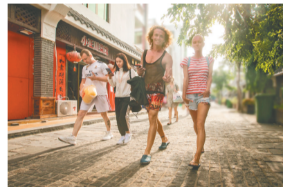
游客在海棠区藤海社区逛街。

如果你有朋友从岛外来三亚，他行程的最后一站很可能是位于海棠区的三亚国际免税城。翻阅史志我们发现，