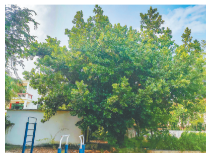
海棠区洪风小学旧校区内的琼崖海棠树。

千百年过去了，如今学子们不需要海棠油灯，也有光明的前程，渔民不再冒险，靠旅游业也能过上好日子，琼崖海棠树依旧扎根在这，顽强、挺拔地生长，让人“知道海棠依旧”。