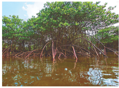
铁炉港的红树林。

昂日岭，蜿蜒流入海棠区境内，流经社区、村庄，最终汇入大海。上千年间，藤桥河冲刷出下游的平原、台地，人们栖居在藤桥河两岸，繁衍生息。