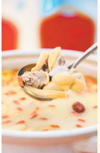
薏米椰子鸡汤。

让我们走进三亚市海棠区，看这里风光旖旎、椰影婆娑，看这里绿洲棋布、河道如网，看这里万物生长、芳草萋萋，领略天赐海棠之美。