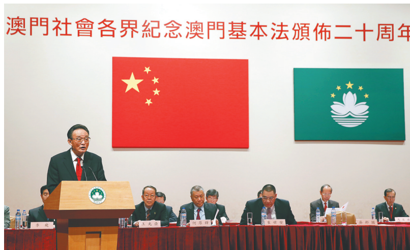
澳門社會各界紀念澳門基本法頒佈二十周年