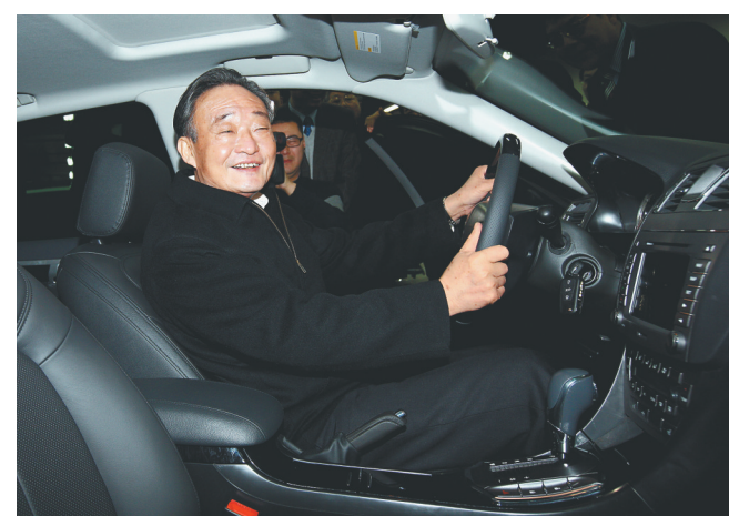
← 2010年1月30日,吴邦国同志在上海汽车集团股份有限公司技术中心察看新能源车。