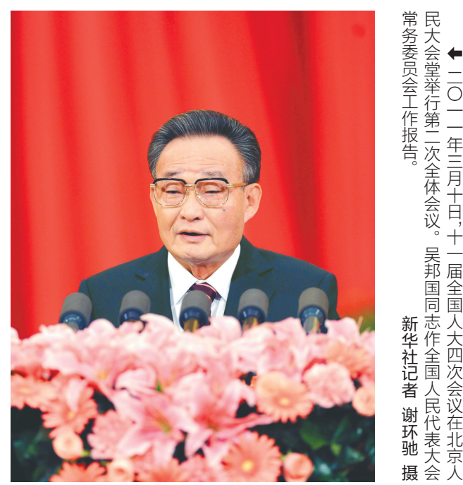
← 二〇一二年三月十日,十一届全国人大四次会议在北京人民大会堂举行第二次全体会议。吴邦国同志作全国人大常委会工作报告。