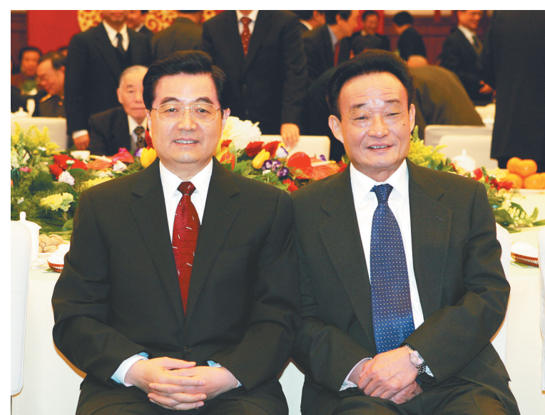
← 二〇〇五年一月一日,全国政协在北京举行新年茶话会。这是胡锦涛同志与吴邦国同志在一起。

吴邦国同志是中国特色社会主义民主法治建设的重要领导者。他强调,如果没有比较完备、高质量的法律法规,就谈不上实现社会主义民主政治的制度化、规范化和程序化,就谈不上依法治国、建设社会主义法治国家。在党中央领导下,他将立法工作作为全国人大及其常委会的首要任务,紧紧围绕党中央确定的立法工作目标,坚持科学立法、民主立法,适应社会主义市场经济发展、社会全面进步和加入世贸组织的新形势,把中国特色社会主义法律体系中基本的、急需的、条件成熟的法律作为立法重点,抓紧制定修改相关法律,集中开展法律清理工作。2003年3月,他担任中央宪法修改小组组长,在中央政治局常委会领导下主持宪法修改工作。由十届全国人大二次会议通过的宪法修正案,确立了“三个代表”重要思想在国家政治和社会生活中的指导地位,明确国家尊重和保障人权、依法保护公民的私有财产权和继承权等内容,对促进我国经济社会发展、推进中国特色社会主义民主法治建设具有重要意义。在他的主持下,第十、十一届全国人大及其常委会共审议通过宪法修正案草案、法律草案、法律解释草案和有关法律问题的决定草案186件,包括物权法、企业破产法、企业所得税法、公务员法、行政许可法、治安管理处罚法、劳动合同法、未成年人保护法、妇女权益保障法、关于加强网络信息保护的决定等。在党中央领导下,他主持制定反分裂国家法,把党和国家对台工作的大政方针和政策措施以法律形式固定下来,为反对和遏制“台独”分裂活动、促进祖国和平统一提供有力法律保障。他主持对香港特别行政区基本法、澳门特别行政区基本法及其附件有关条款作出解释并通过相关决定,推动两个基本法正确实施和“一国两制”方针贯彻落实。他主持制定修改一系列对中国特色社会主义事业发展具有重大影响的法律,为推动形成中国特色社会主义法律体系作出重要贡献。