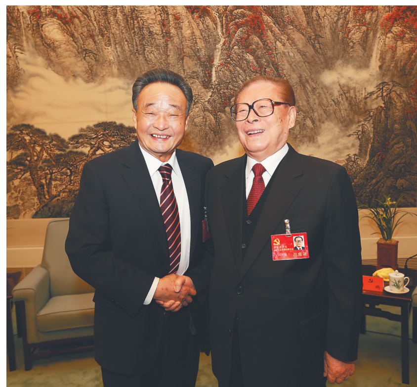
↑ 2012年11月14日,中国共产党第十八次全国代表大会在北京闭幕。这是闭幕会后,江泽民同志与吴邦国同志在一起。新华社记者 兰红光 摄