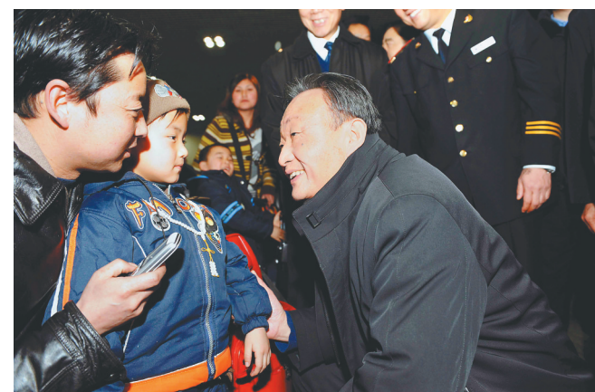
← 2008年2月3日,吴邦国同志在北京西站候车室与旅客交谈。