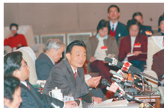
← 1994年3月,时任上海市委书记的吴邦国同志在全国两会上海代表团全团会议上。