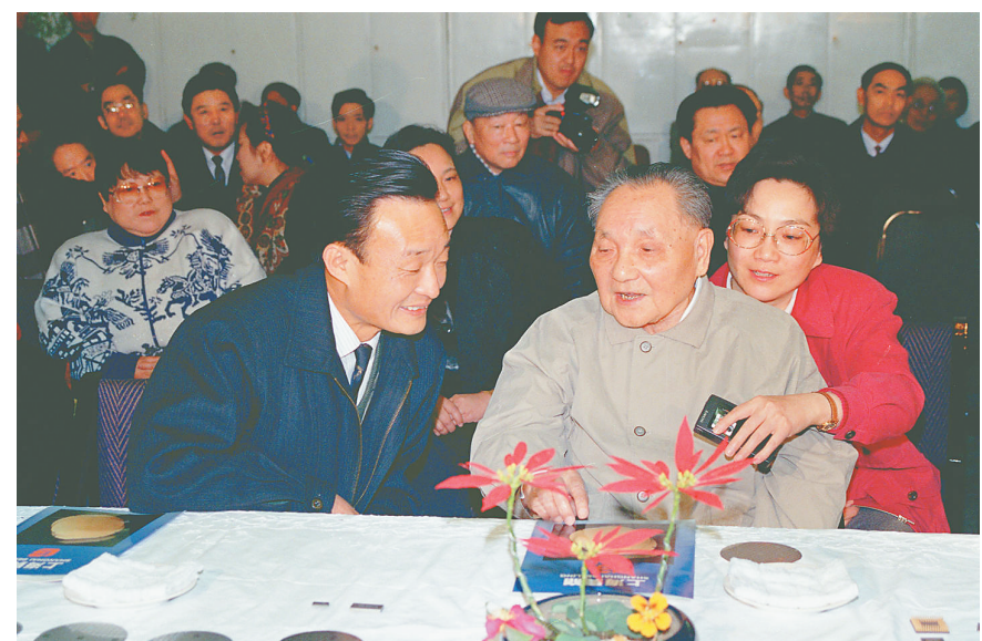
↑ 1992年2月10日,邓小平同志在上海贝岭微电子制造有限公司参观时与吴邦国同志交谈。