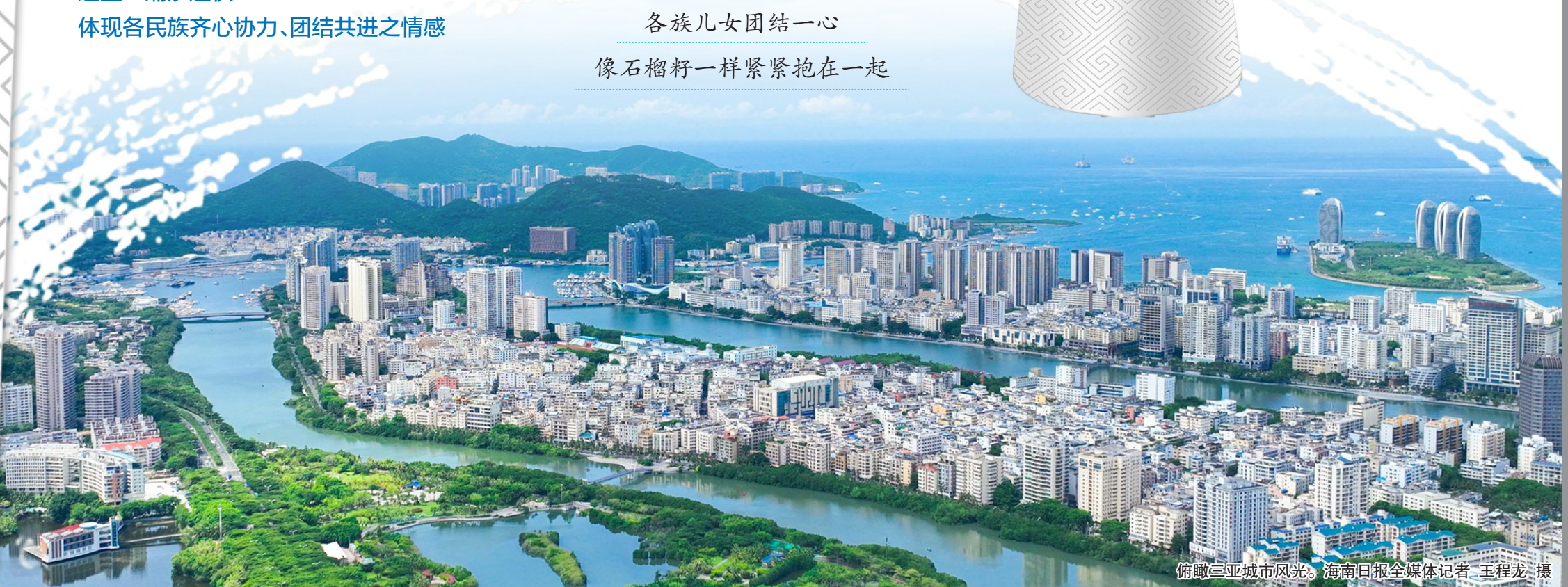
俯瞰三亚城市风光。