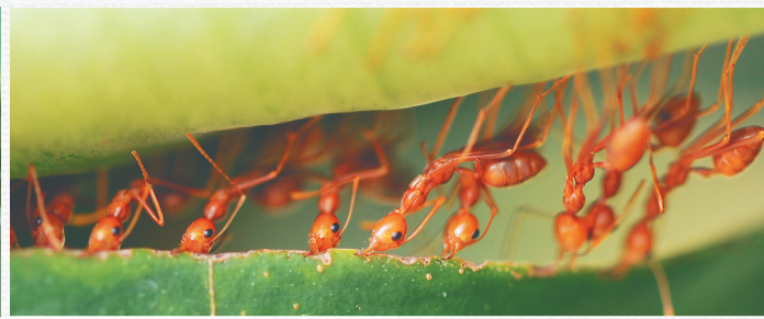
合力筑巢的黄猄蚁。