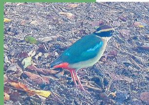
红外相机拍到的仙八色鸫。

另外,在众多带“鸫”字鸟儿中,作为雀形目鸫科地鸫属的鸟类,虎斑地鸫体长约27厘米至31厘米,为大型地鸫,是鸫类中最大的一种。同样,虎斑地鸫以昆虫、小型软体动物和浆果为食,常在地面或低矮植被中觅食,黎明和黄昏时分最活跃。