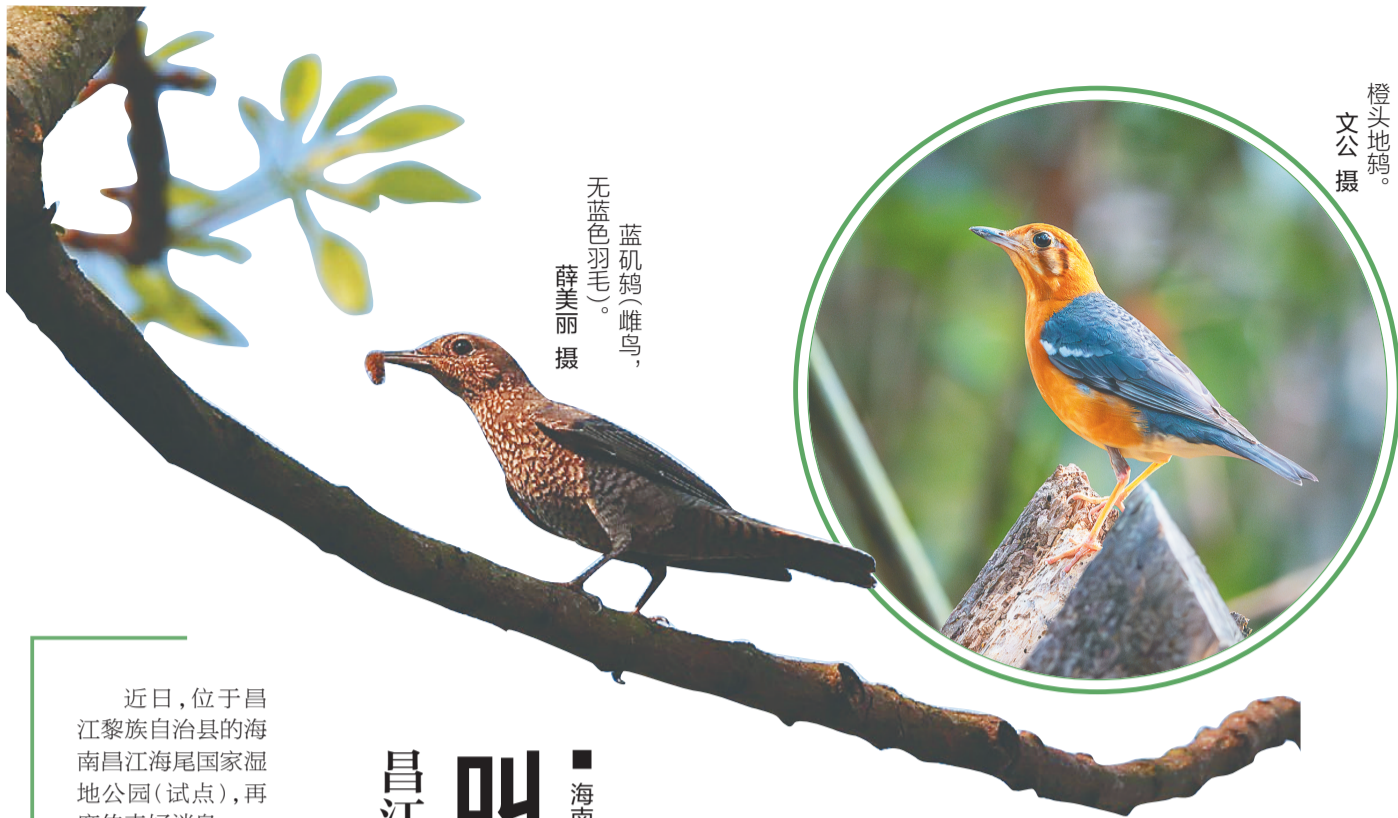
橙头地鸫。