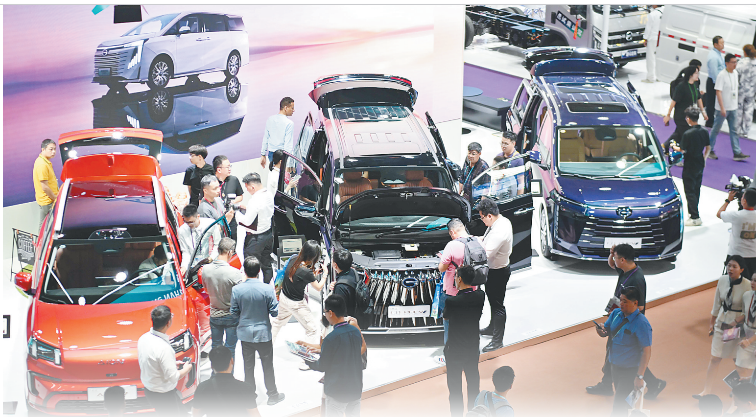
在第136届广交会上，广汽集团的新能源汽车展台吸引参观者。