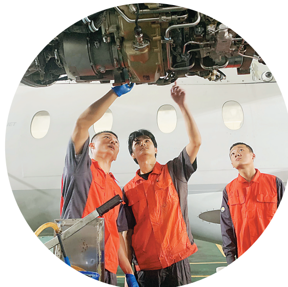
学生们一起讨论飞机维修方案。