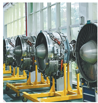
三亚航院日常教学所使用的航空发动机。

2005年，三亚航院在建校之初就开设了我省首个飞机机电设备维修专业。近年来，该校又新增飞机电子设备维修和航空发动机维修技术等专业，构建起我省高校唯一飞机维修类专业群，吸引了不少年轻人来海南学习飞机维修技术，为海南自贸港建设不断输送高水平飞机维修人才。