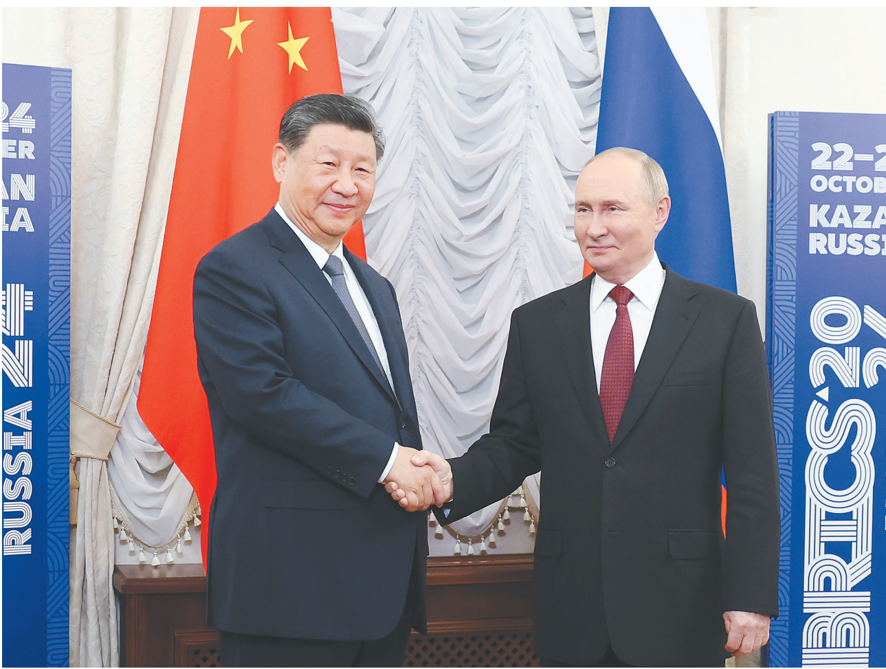
当地时间10月22日下午，国家主席习近平在喀山克里姆林宫同俄罗斯总统普京举行会晤。

新华社俄罗斯喀山10月22日电（记者郝薇 黄河）当地时间10月22日下午，国家主席习近平在喀山克里姆林宫同俄罗斯总统普京举行会晤。习近平指出，今年是中俄建交75周年。75年来，中俄关系风雨兼程，探索出“不结盟、不对抗、不针对第三方”的相邻大国正确相处之道。双方秉持永久睦邻友好、全面战略协作、互利合作共赢精神，不断深化和拓展全面战略协作和各领域务实合作，为推动两国发展振兴和现代化注入强劲动力，为增进中俄人民福祉、维护国际公平正义作出重要贡献。当前，世界正处于百年未有之大变局，国际