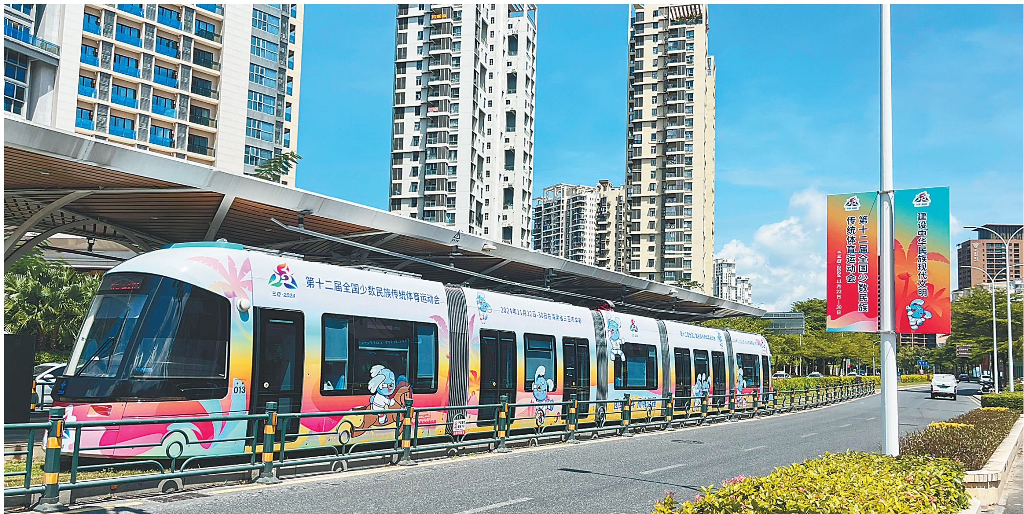
日前,车身绘有运动会吉祥物“吉贝”卡通形象的轨道交通车辆穿梭在三亚市街头,引人注目。