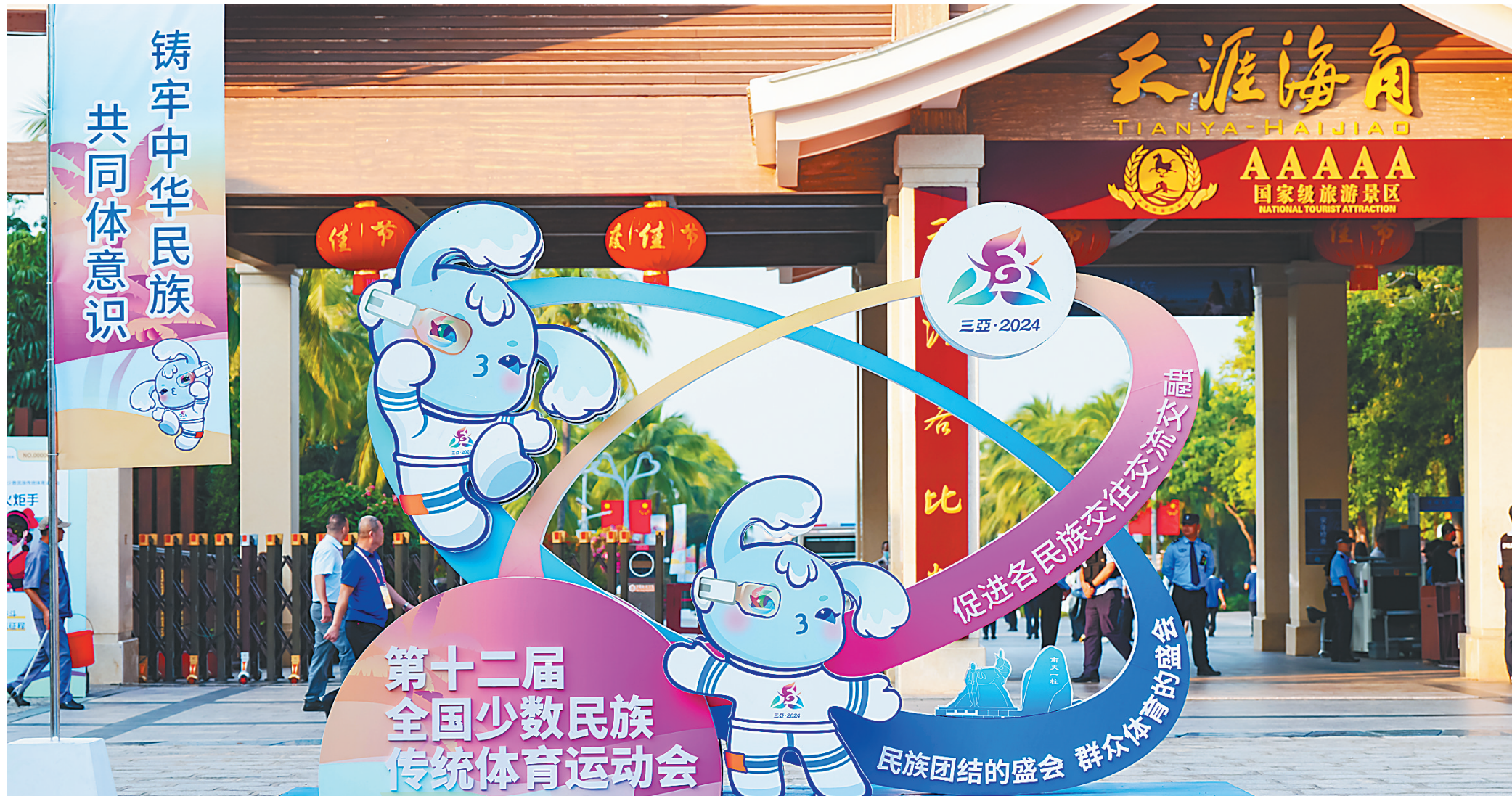
日前,三亚市天涯海角景区入口设置了第十二届全国少数民族传统体育运动会拍照打卡背景板,吸引市民游客留影,为迎接盛会到来营造氛围。