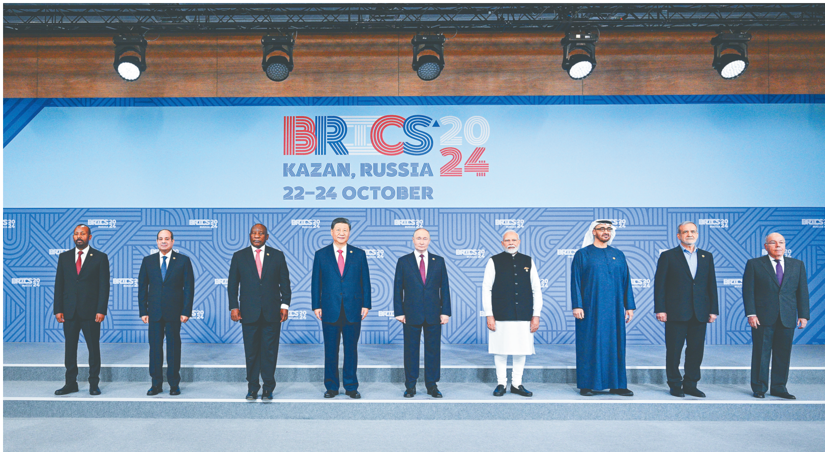
当地时间10月23日上午，金砖国家领导人第十六次会晤在喀山会展中心举行。俄罗斯总统普京主持会晤。中国国家主席习近平、巴西总统卢拉（线上）、埃及总统塞西、埃塞俄比亚总理阿比、印度总理莫迪、伊朗总统佩泽希齐扬、南非总统拉马福萨、阿联酋总统穆罕默德等出席。这是会晤期间，金砖国家领导人集体合影。