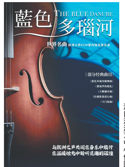
「蓝色多瑙河世界名曲欧洲之声ECM室内烛光音乐会」海报。

“暮光之城电影金曲欧洲之声ECM室内烛光音乐会”将带领观众重温《加勒比海盗》《海上钢琴师》《马戏之王》《爱乐之城》《泰坦尼克号》《请以你的名字呼唤我》等多部经典电影的主题曲和配乐。