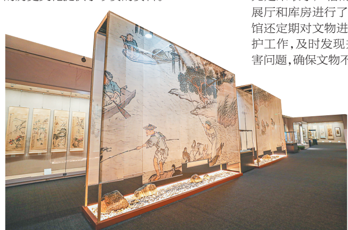
清代吕学的《渔乐图卷》。

此次展览将展至12月1日，一系列书画不仅为观众带来了视觉上的享受，更为研究海南地区的历史文化提供了珍贵的资料。