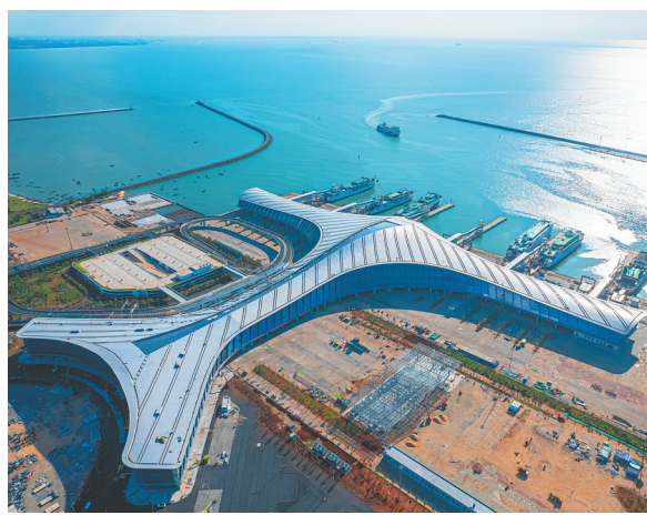
俯瞰海口新海港综合交通枢纽站。