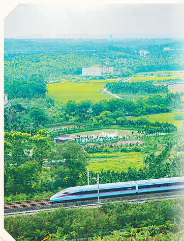
环岛铁路上，一列动车行驶在琼海市的旷野田园中。