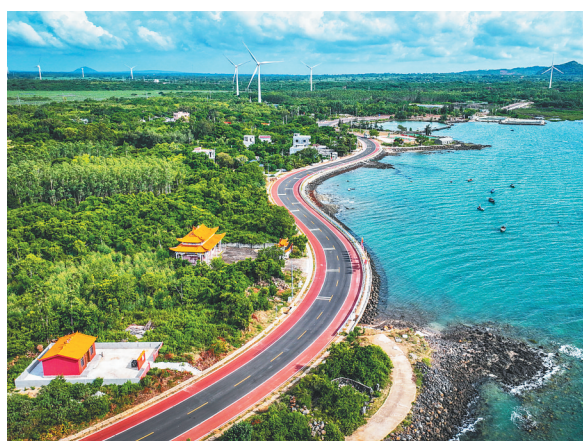
航拍海南环岛旅游公路儋州火山海岸段，风车与道路相映成趣，“一半火山一半海水”的独特风景线尽收眼底。