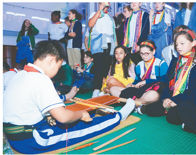
五指山市第一小学学生向巴黎宝丽声童声合唱团展示黎锦技艺。

接近晚7点，雨还在淅淅沥沥落下，透过返程大巴内的白色灯光，依稀可见宝丽声童声合唱团成员们依依不舍。（本报五指山10月29日电）