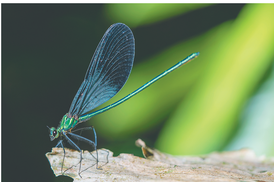
一只色彩艳丽的豆娘。