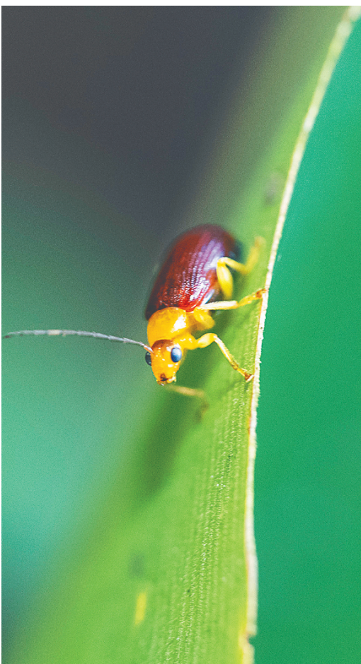
昆虫在叶片上觅食。