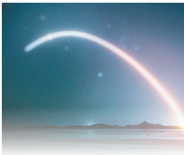
10月30日，搭载神舟十九号载人飞船的长征二号F遥十九运载火箭发射升空。

10月30日凌晨，东风航天城问天阁。“宇航东路”和“航天路”交会处，圆梦园广场上红旗招展，早早来到这里的欢送人群在道路两侧排成两条长龙。 1时37分，神舟十九号载人飞行任务航天员乘组出征仪式在这里举行，蔡旭哲、宋令东、王浩泽3名航天员身着乳白色舱内航天服从问天阁南侧门缓缓走出。 他们边走边向欢送人群挥手致意，欢送人群也喊出了“向航天员学习、向航天员致敬”“祝你们成功、等你们凯旋”的口号。 这是中国人第14次出征太空。 指令长蔡旭哲走在中间。2022年，他首次实现自己的飞天梦想返回地球后，信心满怀地表示“希望有朝一日重返太空家园”。 仅仅过去22个月，他的愿望便又成真。他深情地说：“有祖国和人民的托举，我才能一次又一次征战太空。” 走在蔡旭哲两侧的，是他的两名“90后”战友。 宋令东入选前是空军战斗机飞行员，是我国首个飞天的“90后”男航天员。从翱翔天空到遨游太空，他期待着不辱使命，“将祖国的荣耀写满太空”。 王浩泽入选前是航天科技集团有限公司航天推进技术研究院的高级工程师，是我国目前唯一的女航天飞行工程师，也是继刘洋、王亚平之后，我国第三位执行载人航天飞行任务的女性。 从科研人员到航天员，从托举飞天到自己飞天，王浩泽说：“虽然身份在变，但航天报国的初心和使命不变。” “五星红旗迎风飘扬，胜利歌声多么响亮……”当《歌唱祖国》的旋律响起，86岁的敦煌研究院名誉院长樊锦诗挥起手中的国旗跟着合唱起来。 为给神舟十九号航天员出征送行，这位有“敦煌的女儿”之誉的老人在家人陪同下，专程从敦煌驱车来到出征仪式现场。接受新华社记者专访时，老人说：“我研究的是画在洞窟里的飞天，航天员们才是真正的飞天，我非常敬佩他们。” 从敦煌到酒泉，只有几百公里。从飞天到飞天，已经过去千年。“出发！” 1时38分，中国载人航天工程总指挥、空间站应用与发展阶段飞行任务总指挥部总指挥长许学强下达命令，3名航天员领命出征。 从2003年杨利伟首次飞天至今，从“60后”到“90后”，24位飞天英雄都是从这里一次又一次踏上了飞天之路。 每一次的挥手道别，都是中国载人航天事业的全新突破；每一次对太空的叩问，都绘成了建设航天强国的坚实足迹。