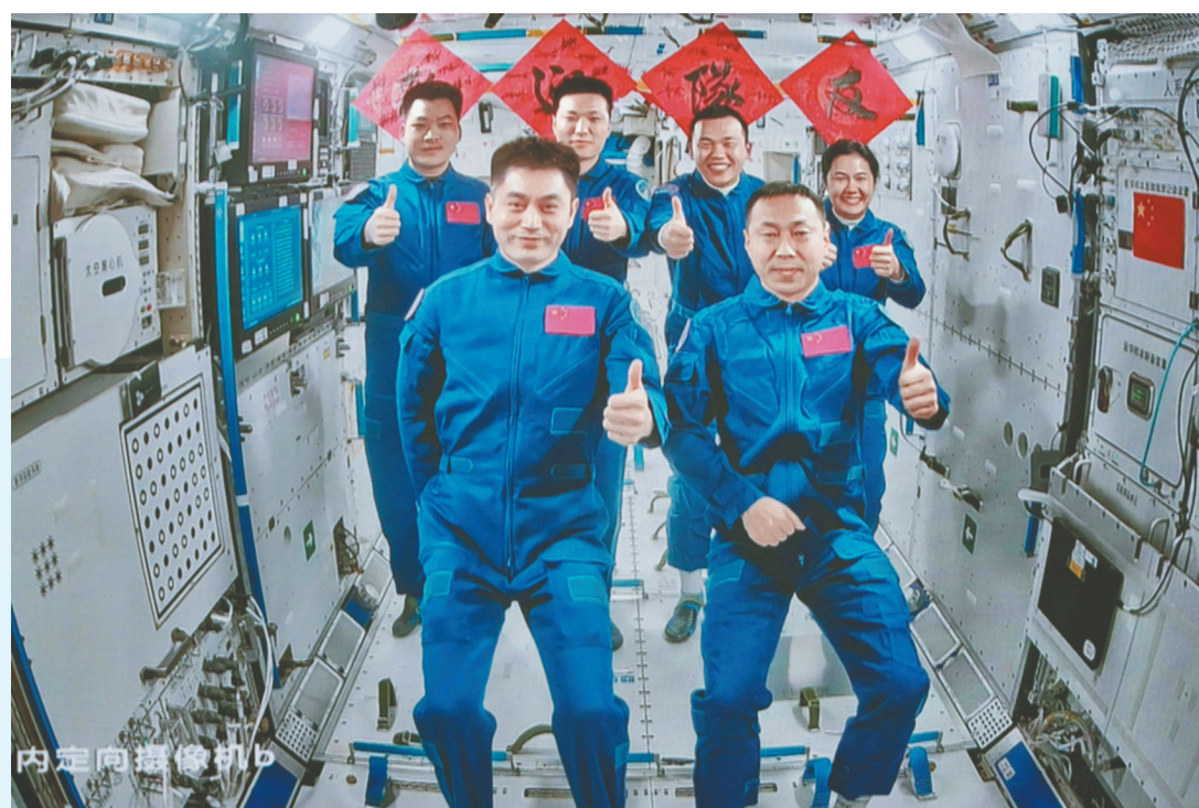
十月三十日在北京航天飞行控制中心拍摄的神舟十九号航天员乘组和神舟十八号航天员乘组“全家福”。