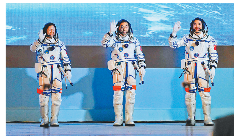
十月三十日，神舟十九号载人飞行任务航天员乘组出征仪式在酒泉卫星发射中心问天阁圆梦园广场举行。

“对于这个名字，大家的意见高度一致。”中国运载火箭技术研究院原副院长冬春，回忆上世纪60年代为运载火箭命名的过程时曾这样说道：“天高路长，太空任务的艰巨性，似乎只有红军长征能够相比。” 斗转星移。 今年是中央红军长征出发90周年，神舟十八号、十九号载人飞船相继从这里升空，再探寰宇。 2025年，中国载人航天工程计划实施神舟二十号、神舟二十一号、天舟九号3次飞行任务。 长征十号运载火箭、梦舟载人飞船、揽月月面着陆器、登月航天服、载人月球车……锚定2030年前实现中国人登陆月球的目标，各项研制建设工作正在全面推进。我们的目标是星辰大海，从未止步。 中国载人航天，永远值得期待。 （新华社酒泉10月30日电 记者李国利 郭明芝 孙鲁明）