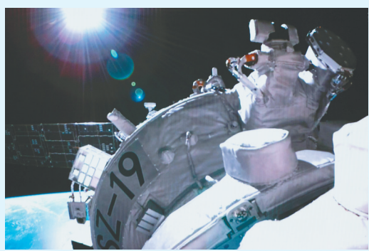
十月三十日在北京航天飞行控制中心拍摄的神舟十九号航天员和空间站天和核心舱前向窗口对接过程的画面。

新华社北京10月30日电（李杰 韩启扬）据中国载人航天工程办公室消息，在载人飞船与空间站组合体成功实现自主快速交会对接后，神舟十九号航天员乘组从飞船返回舱进入轨道舱。北京时间2024年10月30日12时51分，在轨执行任务的神舟十八号航天员乘组顺利打开“家门”，欢迎远道而来的神舟十九号航天员乘组入驻中国空间站，“70后”“80后”“90后”航天员齐聚“天宫”，完成中国航天史上第5次“太空会师”。随后，两个航天员乘组拍下“全家福”，共同向牵挂他们的全国人民报平安。 后续，两个航天员乘组将在空间站进行在轨轮换。其间，6名航天员将共同在空间站工作生活约5天时间，完成各项既定工作。