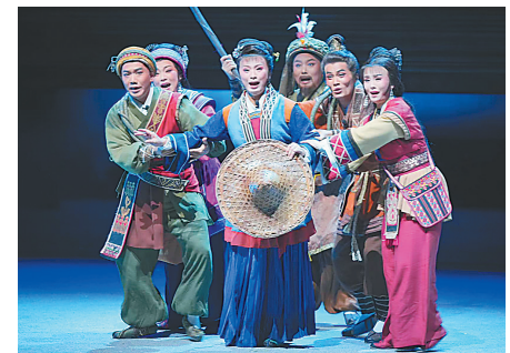
琼剧《黄道婆》剧照。

琼剧《黄道婆》以其独特的舞蹈艺术和深刻的情感共鸣,交出了一份满意的答卷。它不仅展现了舞蹈艺术在戏曲中的重要作用,更是一次成功的现代演绎。通过舞蹈与情感的交融、剧情的推动,人物的塑造以及空间语言的创新,琼剧《黄道婆》为当代戏曲舞蹈的发展提供了新的思路 and 方向。