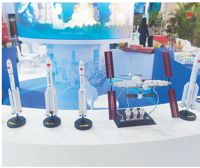
进博会海南馆推介航天旅游,展示火箭模型等。