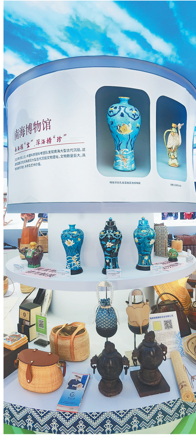
进博会海南馆“文化打卡地”展区。