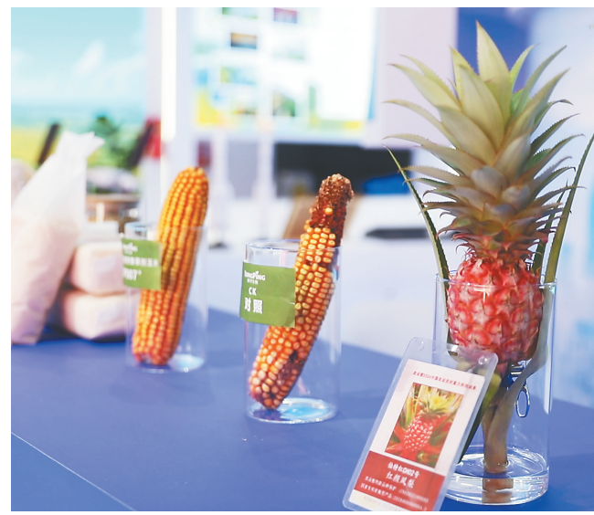
进博会海南馆展示的南繁育种相关产品。