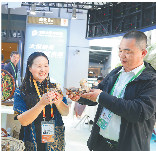
进博会上看海南 展馆火热 好物受捧

不少观展者来到中国馆参观，了解海南自贸港发展新气象。一些与会人员表示，通过文字、视频、实物模型等形式，可以清晰感受到海南自贸港的活力，未来发展前景令人期待。