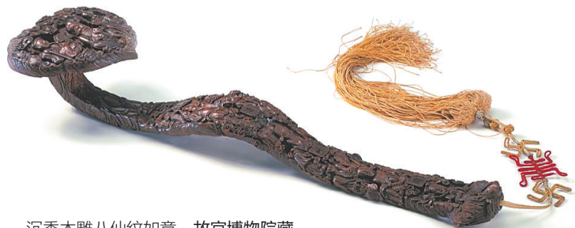
沉香木雕八仙纹如意。故宫博物院藏