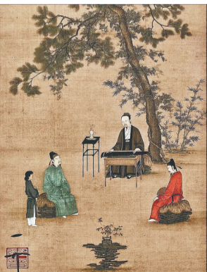
宋徽宗《听琴图》中出现了香炉。