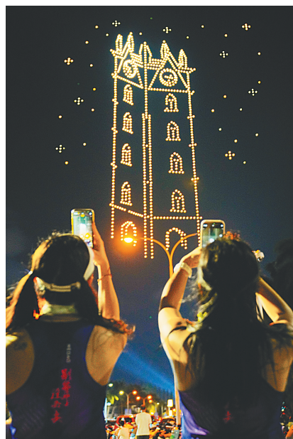
在海口世纪公园举行的无人机表演。

刘昱: 今年以来,全国已有27个省(市、自治区)在政府工作报告中提及低空经济发展,海南目前正在加快建设世界最高水平开放形态的自贸港,具备政策创新的先发优势。中国通航积极凭借海南自贸港政策优势和自身专业优势,深度参与海南低空经济全产业链升级。通过设立海南低空经济产业投资基金、建设海南低空立体交通服务平台、完善机场基础设施网络等方式,以海南海岛特色应用场景为依托,积极引进低空经济产业链上游大型无人机研发和验证飞行项目、中游通航运行及保障、下游通用航空器和航材贸易及金融衍生等产业的导入和转型,服务低空产业全生命周期,撬动省内低空经济产业整合发展。