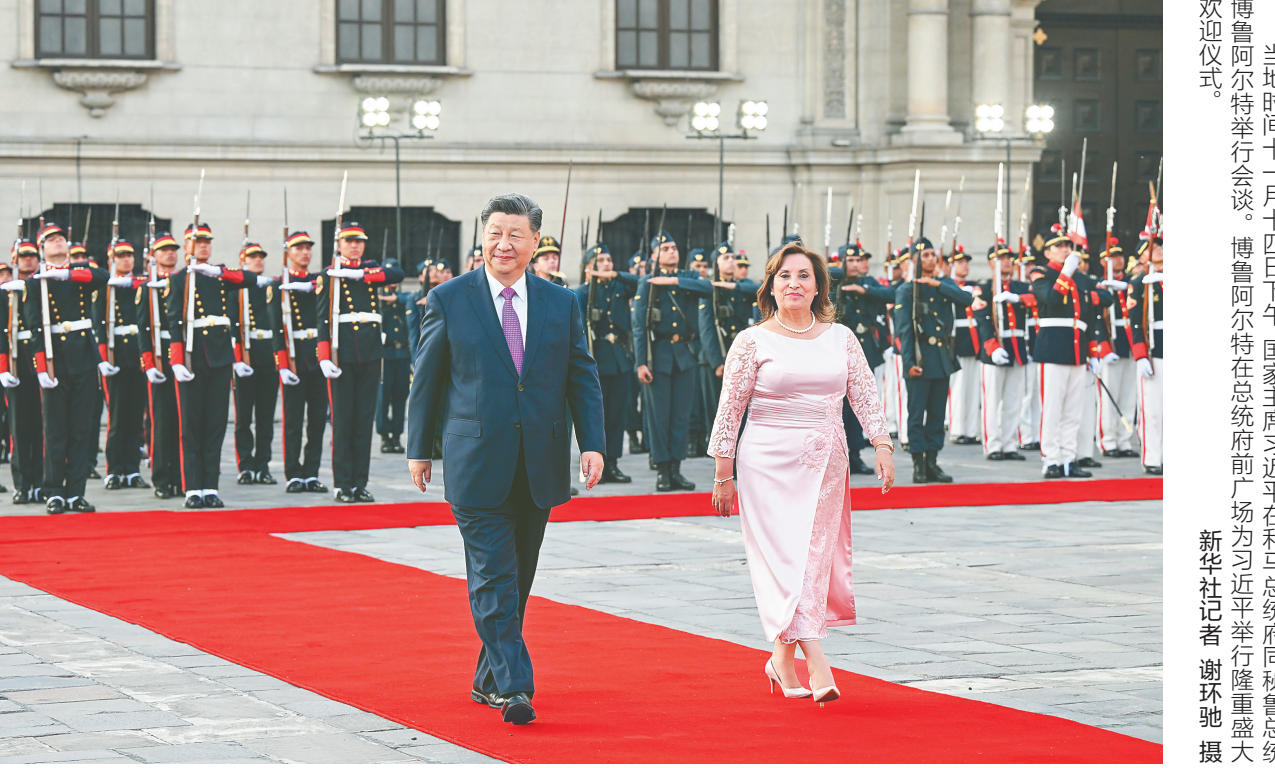
当地时间十一月十四日下午，国家主席习近平在利马总统府同秘鲁总统博鲁阿尔特举行会谈。博鲁阿尔特在总统府前广场为习近平举行隆重盛大欢迎仪式。

新华社利马11月14日电(记者倪四义、郝薇)当地时间11月14日下午，国家主席习近平在利马总统府同秘鲁总统博鲁阿尔特举行会谈。初夏时节的利马，阳光明媚，鲜花盛开。在秘鲁礼宾部队护卫下，习近平乘车抵达总统府，受到博鲁阿尔特总统热情迎接。博鲁阿尔特在总统府前广场为习近平举行隆重盛大欢迎仪式。两国元首分别同对方陪同人员握手致意。习近平在博鲁阿尔特陪同下检阅仪仗队，军乐团奏中秘两国国歌。欢迎仪式后，两国元首举行会谈。习近平指出，这是我第三次访问秘鲁，也是一年时间里第三次同总统女士会晤。许多秘鲁民众自发聚集道路两旁，挥手致意表示欢迎，让我深切感受到秘鲁人民对中国人民的友好情谊。中秘同为文明古国。古老文明的深厚积淀，赋予中秘两国智慧和胸怀，让我们能够看清历史前进方向，顺应时代发展潮流，始终坚持平等相待、互尊互信、互学互鉴，成为不同体量、不同制度、不同文化国家团结合作的典范。建交53年来，特别是我2016年对秘鲁进行首次国事访问以来，在双方共同努力下，中秘贸易投资合作快速增长，为两国人民带来实实在在的在利益。双方要总结经验，推动两国务实合作提质升级，使中秘全面战略合作伙伴关系不断迈上新台阶，更好造福两国人民。习近平指出，双方要对接发展战略，深挖合作潜力，打造务实合作新格局，加强贸易和投资“双轮驱动”，推动传统产业和新兴产业“两翼齐飞”，促进产业链和供应链“两链融通”。中方愿继续扩大进口秘鲁特色优质农产品，鼓励有实力的中国企业赴秘鲁投资兴业，为当地发展作出应有贡献。双方要统筹推进矿产能源、基础设施、交通通信等传统领域合作，拓展数字经济、人工智能、绿色航运、电动汽车、光伏产业等新兴领域合作。中方愿鼓励中国企业参与秘鲁基础设施建设“硬联通”，推动智慧海关“软联通”。中国企业克服困难如期完成钱凯港项目一期工程，充分表明中方同秘方开展长期战略合作的决心。中方愿同秘方一道，充分发挥钱凯港区位优势，打造以钱凯港为起点的中拉陆海新通道，探索构建从沿海到内陆、从秘鲁到拉美其他国家的立体、多元、高效互联互通格局，带动拉美和加勒比地区整体发展和一体化建设。中方支持苏州市同钱凯市建立友城关系，愿同秘方开展工业园区建设经验交流，拓展跨境服务贸易、电子商务等领域合作，发挥集群效应和联动效应，用更多务实成果坚定中秘长期友好互利合作的信心。下转A02版▶