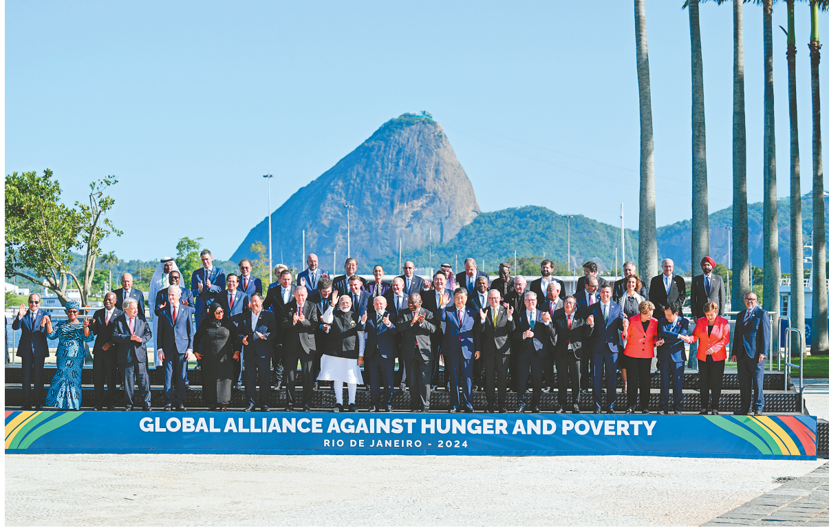
当地时间11月18日上午,国家主席习近平在巴西里约热内卢出席二十国集团领导人第十九次峰会。峰会把“构建公正的世界和可持续的星球”作为主题,并决定成立“抗击饥饿与贫困全球联盟”。这是习近平同与会领导人共同参加巴方发起的“抗击饥饿与贫困全球联盟”合影。

新华社里约热内卢11月18日电(记者倪四义 姜岩)当地时间11月18日上午,国家主席习近平在巴西里约热内卢出席二十国集团领导人第十九次峰会。在峰会第一阶段围绕“抗击饥饿与贫困”议题讨论时,习近平发表题为《建设一个共同发展的公正世界》的重要讲话。习近平指出,当今世界百年变局加速演进,人类发展面临的机遇和挑战前所未有。作为世界主要大国领导人,我们应秉持人类命运共同体意识,扛起历史责任,展现历史主动,推动历史进步。中国主办二十国集团领导人杭州峰会时,首次将发展议题放到宏观经济政策协调的中心位置,这次里约热内卢峰会把“构建公正的世界和可持续的星球”作为主题,并决定成立“抗击饥饿与贫困全球联盟”。从杭州到里约热内卢,我们都致力于同一个目标,即建设一个共同发展的公正世界。为了建设这样的世界,我们要在贸易投资、发展合作等领域增加资源投入,做强发展机构,多一些合作桥梁,少一些“小院高墙”,让越来越多发展中国家过上好日子、实现现代化;要支持发展中国家采取可持续的生