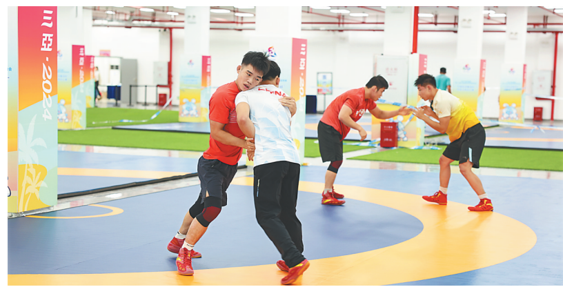
广西代表团民族式摔跤队进行适应性训练。

据介绍，11月18日，第十二届全国少数民族传统体育运动会广西代表团正式抵达三亚，331名运动员将参加17个竞赛项目及7个表演项目的比赛，共襄民族团结的盛会、群众体育的盛会。