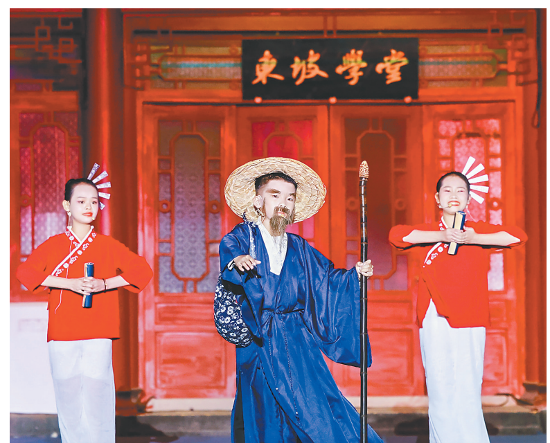
海南省大中小学生诵读“东坡诗词”大赛比赛现场。

当晚，经过角逐，那大八小的节目获得小学组一等奖。在孩子们的欢呼声和笑脸中，东坡精神在他们心里深深扎根。（本报那大11月19日电）