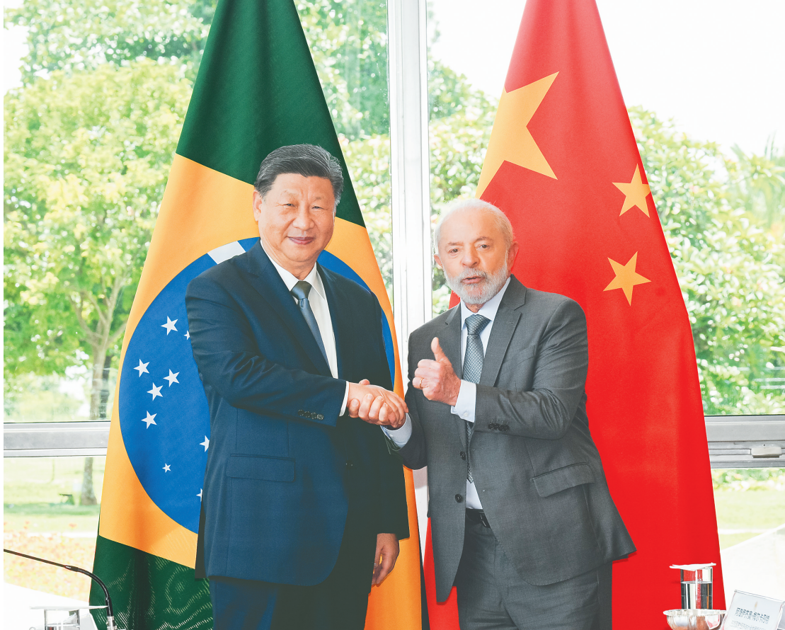
当地时间11月20日上午，国家主席习近平在巴西利亚总统官邸黎明宫同巴西总统卢拉举行会谈。

新华社巴西利亚11月20日电(记者倪四义 陈威华)当地时间11月20日上午，国家主席习近平在巴西利亚总统官邸黎明宫同巴西总统卢拉举行会谈。两国元首宣布，将中巴关系定位提升为携手构建更公正世界和更可持续星球的中巴命运共同体。