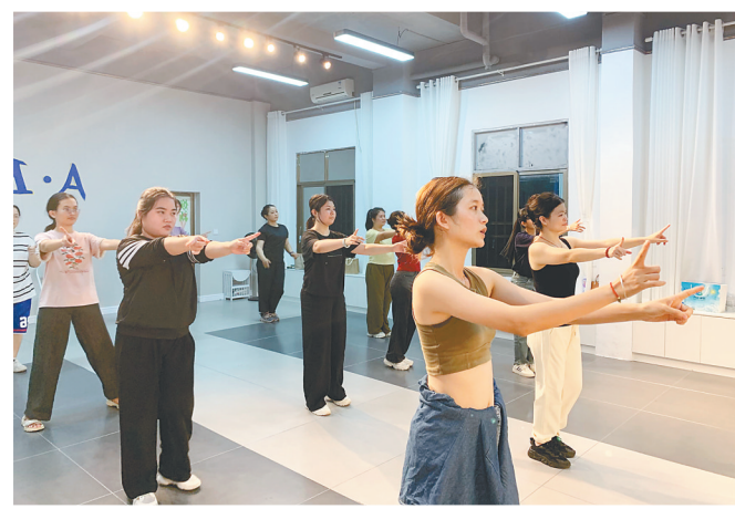
在东方市八所城区华声琴行舞蹈室，十多名学员学习爵士舞。

7月17日晚，在东方市第三实验学校的足球场上，来自东方市微羽CT飞盘俱乐部的公益讲师汪佩哲给学员们讲解有关飞盘的运动技巧。在现场，30多名学员以每两人为一单