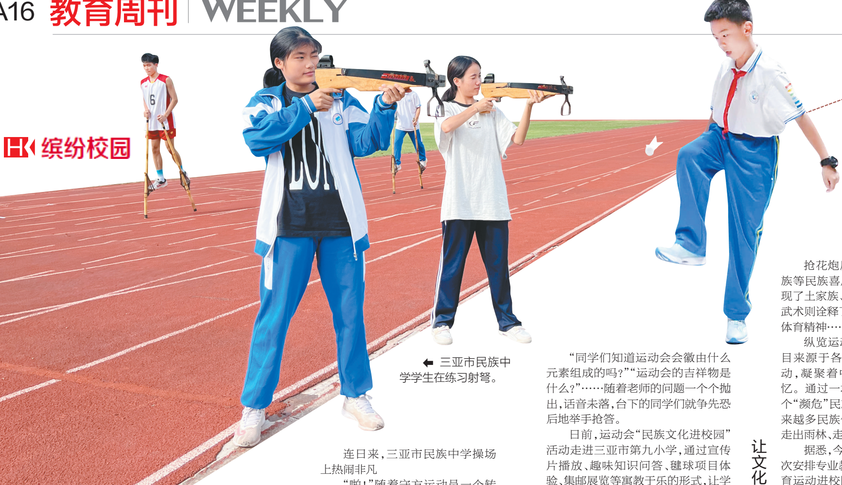
三亚市民族中学学生在练习射箭。