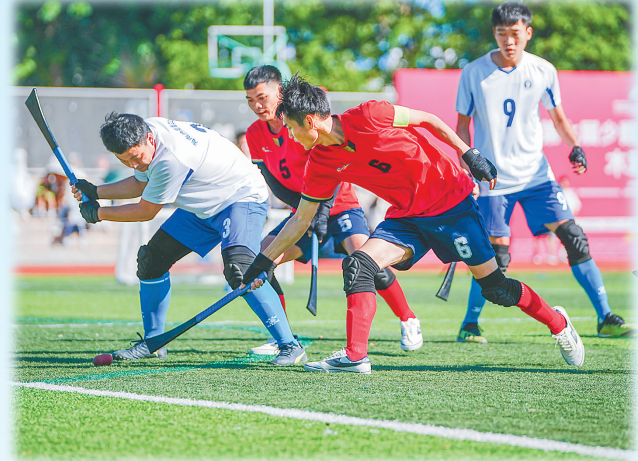
海南省第七届少数民族传统体育运动会木球比赛现场。

23日-24日 8:30-12:00 15:00-18:30 25日 8:30-12:00 27日 9:00-12:00 28日-29日 10:00-11:00 三亚学院体育场