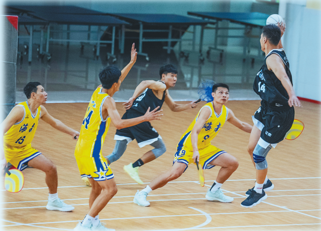
第十二届全国少数民族传统体育运动会珍珠球项目海南代表团同河南代表团一同训练。

23日-25日 8:00-12:00 15:00-19:00 26日 8:00-12:00 27日 8:00-12:00 15:00-17:00 28日 8:00-11:00 15:00-17:00 29日 10:00-12:00 海南省三亚技师学院体育馆