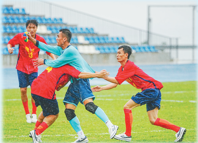
海南省第七届少数民族传统体育运动会花炮比赛现场。

23日-25日 14:00-18:00 27日-28日 15:00-17:30 29日 15:00-18:00 陵水黎安国际教育创新试验区体育场