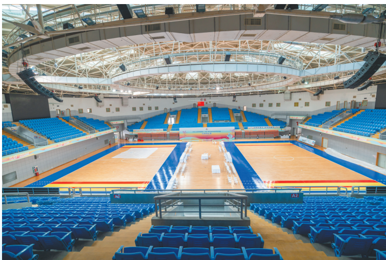
珍珠球项目场馆、海南省三亚技师学院体育馆位于三亚市吉阳区荔枝沟路53号，建筑面积1.2万平方米，设有4000个座位。