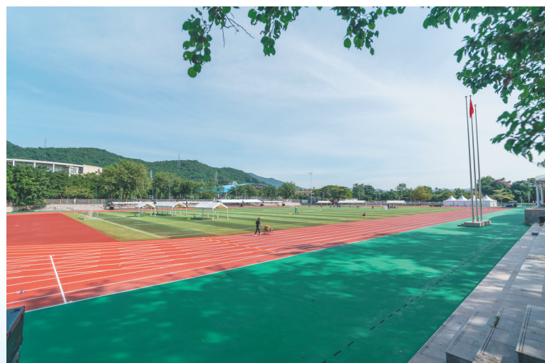
木球项目场地、三亚学院体育场位于三亚市吉阳区书成路与书信路交叉口往西北约90米，占地面积1.6万平方米，坐席数1300座。