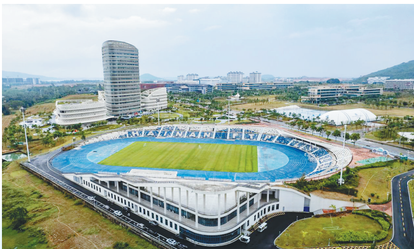
花炮项目场地、陵水黎安国际教育创新试验区体育场内场可容纳约1万名观众。室内场馆面积约5300平方米，设有运动员休息室等相关配套设施。