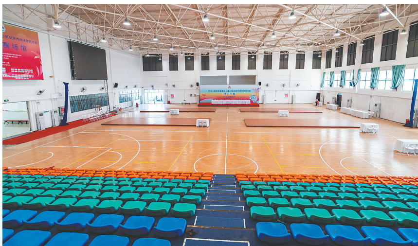
押加项目场馆、海南热带海洋学院体育馆位于三亚市吉阳区育才路1号，建筑面积6800平方米，移动坐席数约500座。