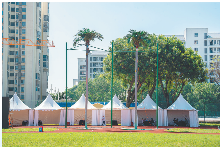
攀椰竞速项目场地、西南大学三亚中学体育场位于三亚市吉阳区抱坡岭，场地长105米，宽70米，为标准体育场，坐席数800座。