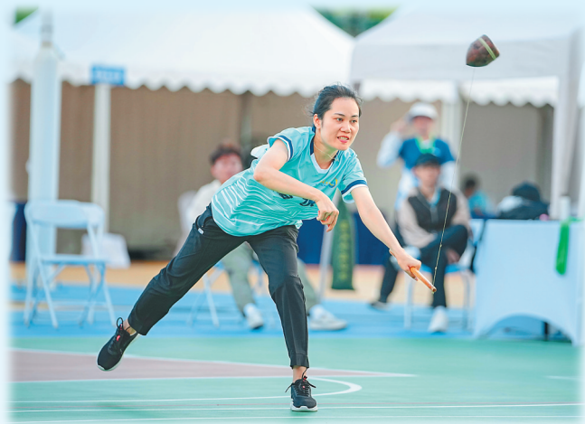
参加海南省第七届少数民族传统体育运动会陀螺项目的选手在投掷陀螺。

23日-25日 8:30-11:30 15:00-18:00 27日-29日 8:30-11:30 15:00-18:00 海南省三亚技师学院篮球场