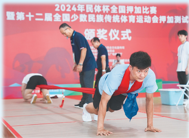
2024年民体杯全国押加比赛暨第十二届全国少数民族传统体育运动会押加测试赛现场。

23日-25日 8:30-11:30 15:00-18:00 27日 8:30-12:00 海南热带海洋学院体育馆