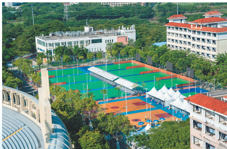
陀螺项目场地、海南省三亚技师学院篮球场位于三亚市吉阳区荔枝沟路53号，占地面积8500平方米。