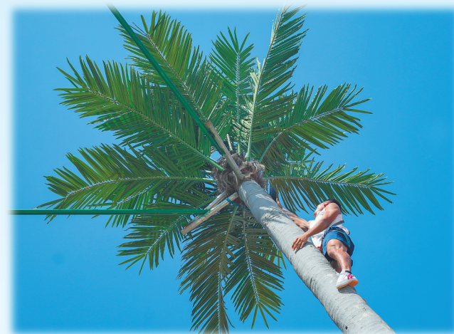
参加第十二届全国少数民族传统体育运动会攀椰竞速项目的选手正加紧训练。

23日 9:00-12:00 16:00-18:00 24日 9:00-12:00 西南大学三亚中学体育馆