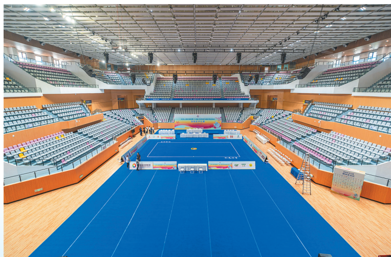
民族武术项目场馆、三亚学院体育馆位于三亚市吉阳区迎宾大道学院路三亚理工职业学院内，地下一层、地上四层结构，座席数4138座。