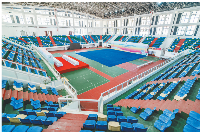
民族健身操项目场馆、西南大学三亚中学体育馆位于三亚市吉阳区抱坡岭，建筑面积7333平方米，座席数2047座。