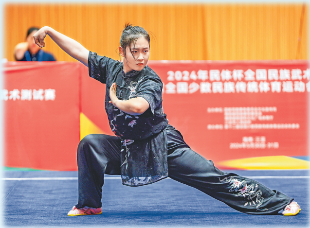
2024年民体杯全国民族武术比赛暨第十二届全国少数民族传统体育运动会民族武术测试赛现场。

23日 9:00-11:00 15:00-17:00 24日 9:00-11:00 15:00-17:00 25日 9:00-11:00 15:00-17:00 三亚学院体育馆