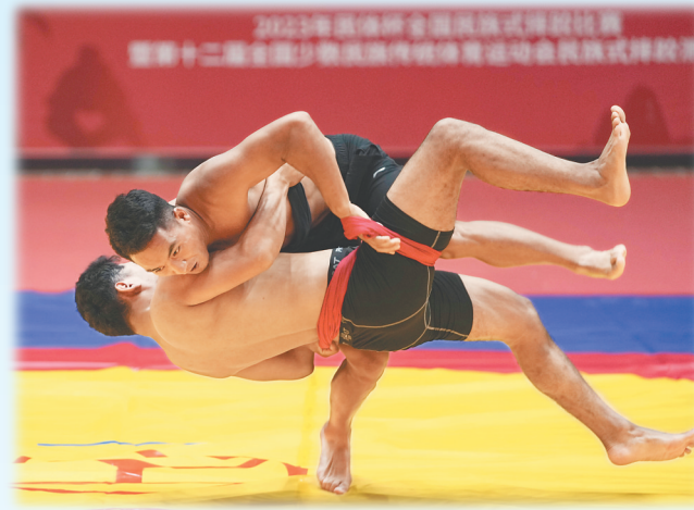
2023年民体杯全国民族式摔跤比赛现场。

23日 9:00-12:00 15:00-18:00 24日 9:00-12:00 15:00-18:00 25日 9:00-12:00 15:00-18:00 27日 9:00-12:00 15:00-18:00 28日 9:00-12:00 15:00-18:00 三亚市第一中学体育馆(场)