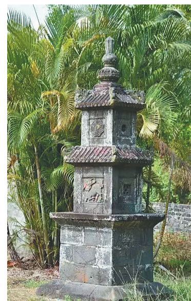
儋州官屋村建于明代的敬字塔。