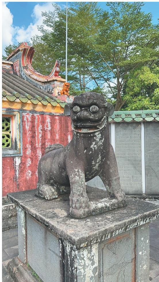
澄迈罗驿村李氏宗祠门前的石狗。

近百年来，海南各地乡村发现和出土了一大批珍贵的可移动文物和不可移动文物。这些文物保留着先辈们的生产生活遗迹和文化烙印，折射出海南的海洋文化、耕读文化、信俗文化、少数民族文化等。