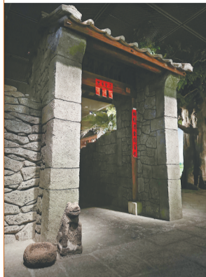
海南省博物馆营造的石狗场景。