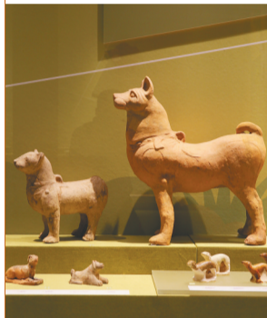
藏于海南省博物馆的陶狗。

已延绵两千多年。海南的石狗主要分布于琼北地区，先民们用火山石建造房屋、制作农具、修桥铺路，同时雕刻石狗。大大小小、形态各异的石狗被放置在路口、桥头、村口、家门口，类似镇邪祛恶的泰山“石敢当”。因为他们相信石狗具有神性，可以保佑作物丰收、人畜兴旺、家宅平安、添丁发财等。