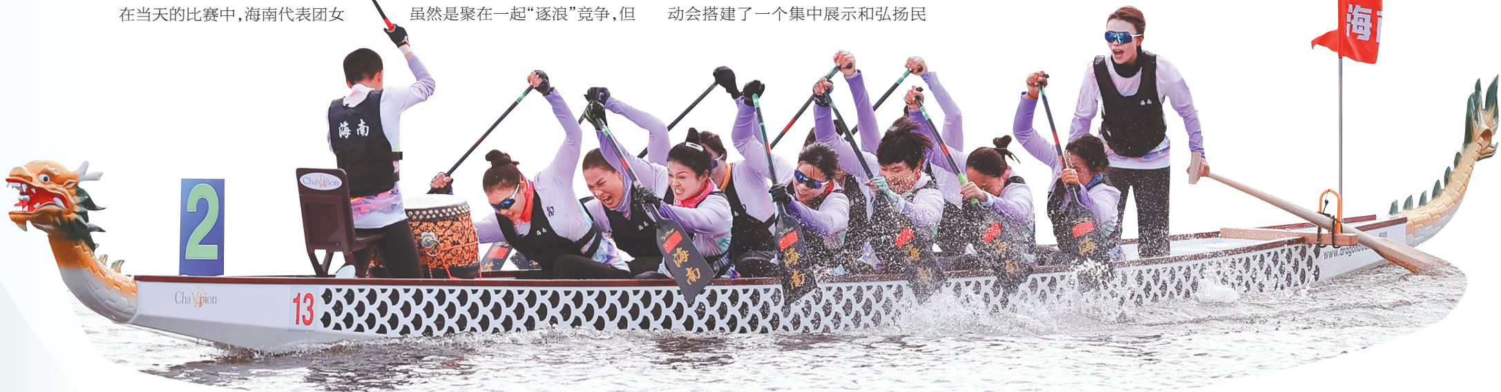
十一月二十五日,海南队在决赛中从起点出发。最终海南队获得一等奖。