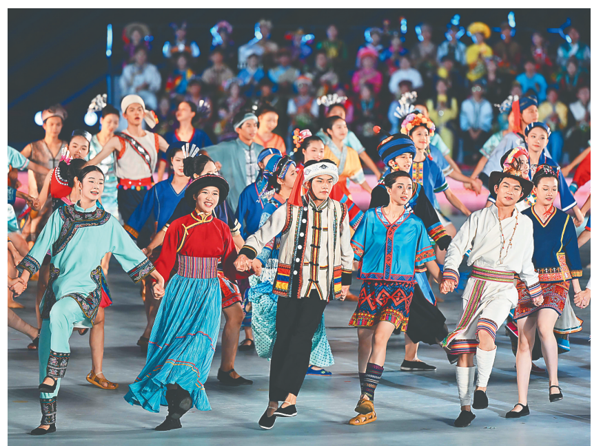
11月26日，第十二届全国少数民族传统体育运动会民族大联欢(文艺演出)在三亚市亚沙公园举行。精彩纷呈的节目表演，风情浓郁的少数民族歌舞，展现出各族人民的团结情谊。

本报三亚11月26日电(海报集团全媒体记者邱江华)海风徐徐，阳光明媚。11月26日，以“民族大联欢 天涯共此时”为主题的第十二届全国少数民族传统体育运动会(以下简称运动会)民族大联欢活动在三亚市天涯海角风景区及亚沙公园一期指环剧场举行。上万名运动员、嘉宾和志愿者一起踏歌起舞，唱响民族团结友谊的动人旋律。