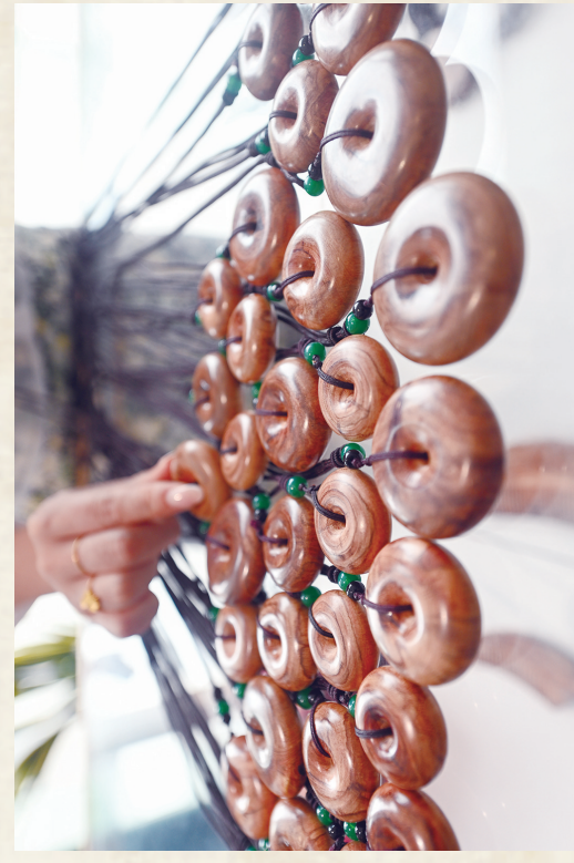
海南花梨谷文化旅游区文创中心的花梨文创产品。