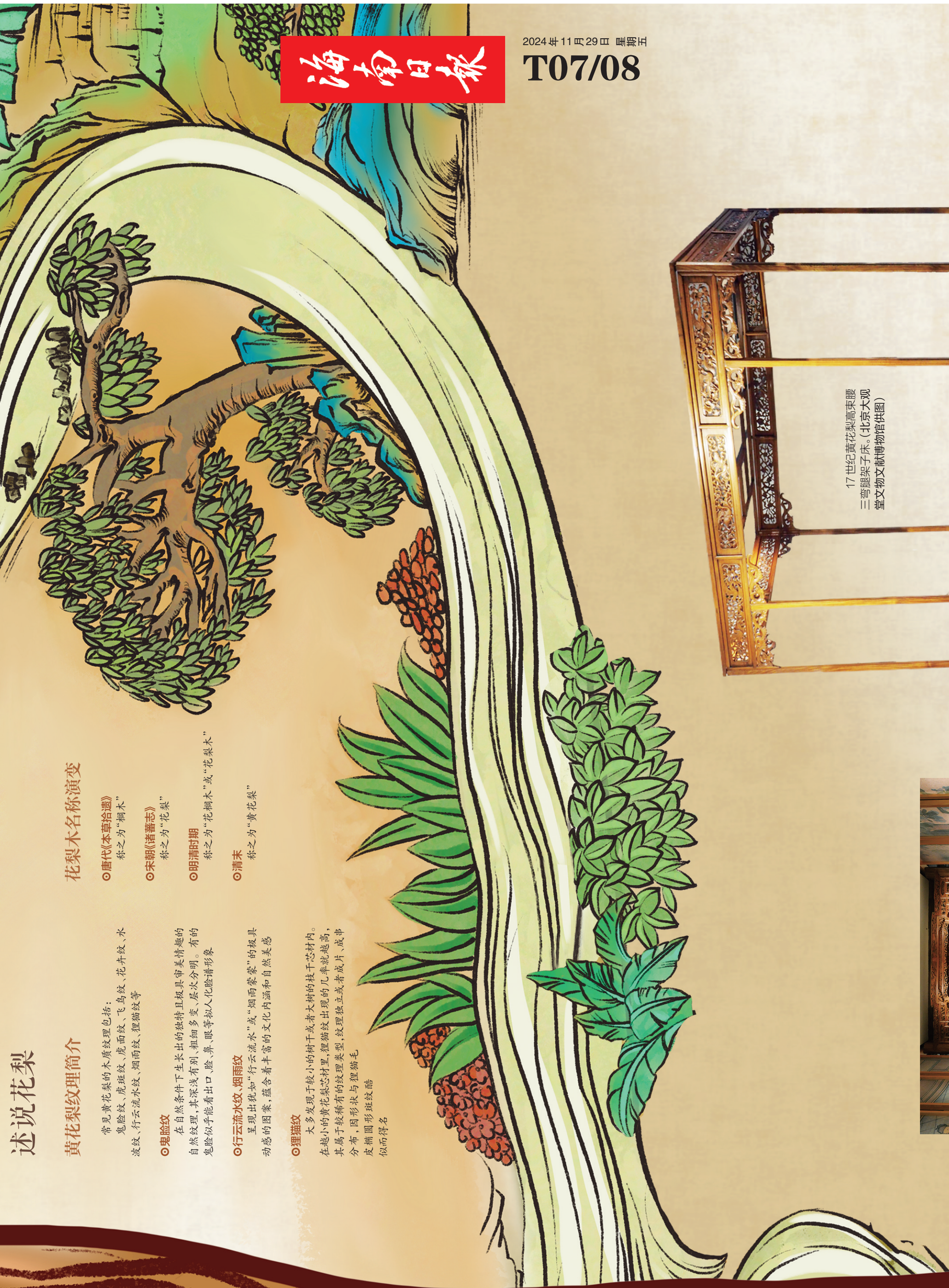
17世纪黄花梨高束脚三弯腿架子床。(北京大观园文物馆提供供图)