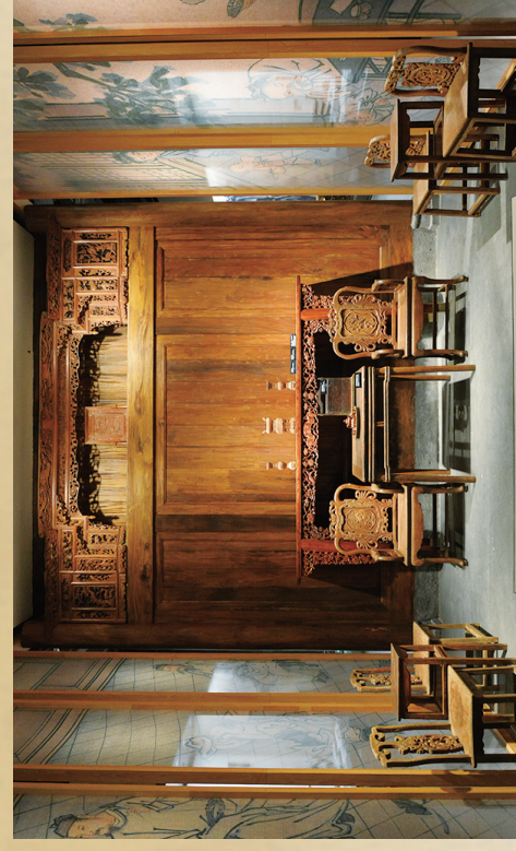
海南博物馆“木中皇后——海南花梨陈列”（花梨馆）展陈。

到了明代，作为顶级木材，海南黄花梨与明式家具碰撞出耀眼的光芒，也让它身价一路飙升，成为家具用料领域的至尊之木。明代晚期至清代中期，黄花梨成为制作皇宫高档家具的主要用料。明清宫殿家具结构独特，构思奇巧，雕镂精细，巧夺天工，用海南黄花梨心材制作的明清家具简练雅致，经久耐用，且能长久地散发清幽的香气，具有非同寻常的收藏价值。