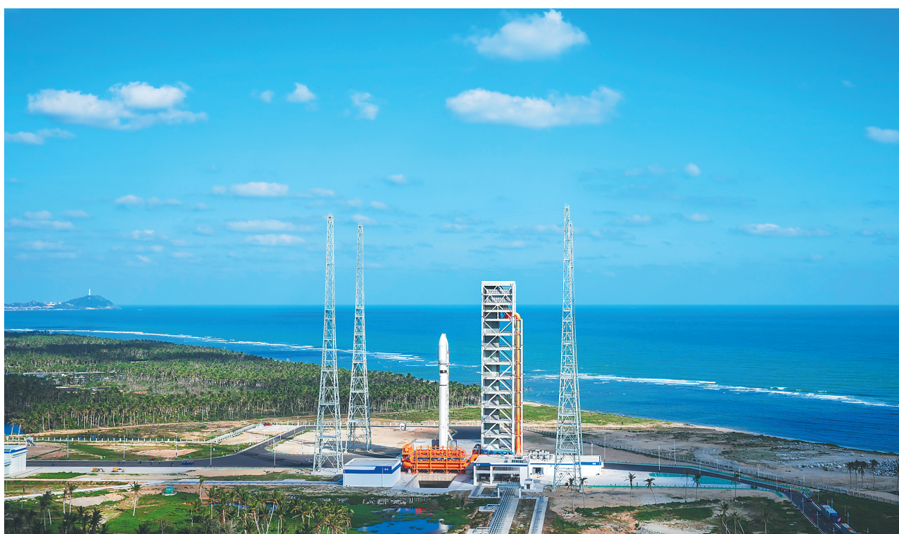
11月30日,在海南商业航天发射场二号工位预备发射的新型运载火箭长征十二号。当天22时48分,我国首个商业航天发射场——海南商业航天发射场首次发射取得圆满成功。