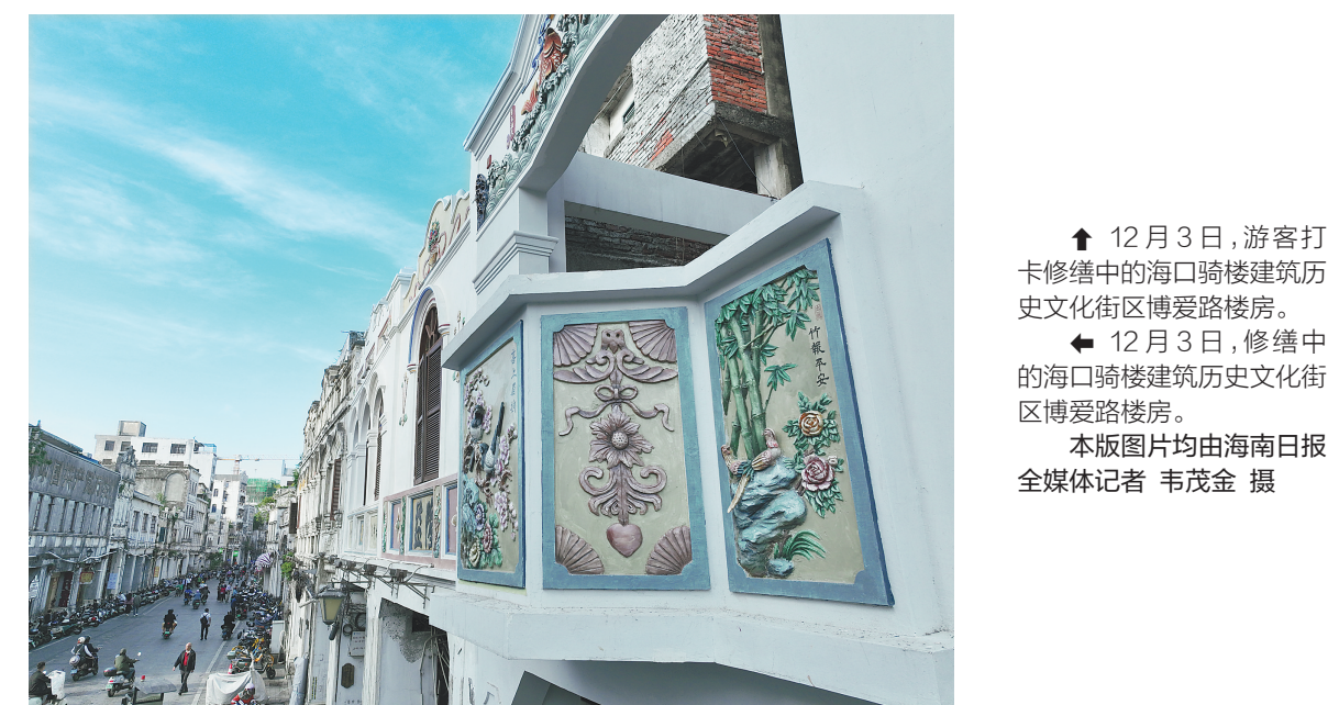
↑ 12月3日，游客打卡修缮中的海口骑楼建筑历史文化街区博爱路楼房。 ↓ 12月3日，修缮中的海口骑楼建筑历史文化街区博爱路楼房。