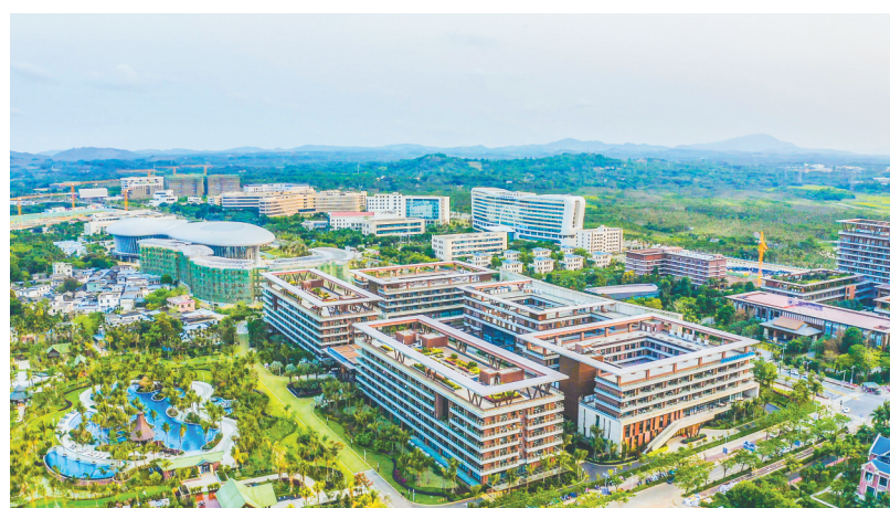
俯瞰博鳌乐城国际医疗旅游先行区。(资料图)

医疗健康产业集群成势。琼海医疗健康产业已初具规模,具备坚实基础,海南国械手术机器人、一龄健康科技产业园、明鑫制药、高华制药等医疗