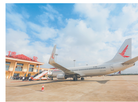
琼海博鳌机场。

从招商引资到项目建设,从服务企业到营造一流营商环境,这背后是琼海上下全力以赴拼经济、稳增长、促发展的决心和信心。琼海市政府主要负责人表示,琼海将继续主动作为、靠前服务,进一步优化发展“软环境”,精准掌握企业发展中存在的困难问题,为企业发展和项目建设提供全方位、全流程支持服务。