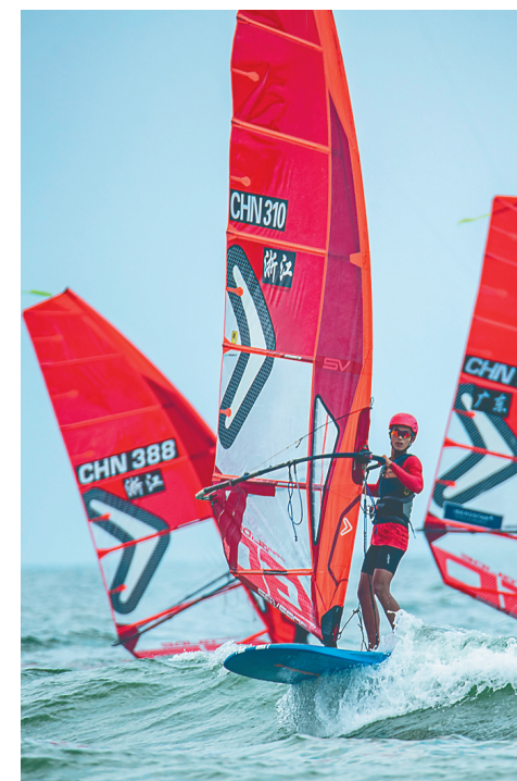
运动员驾驶帆板在琼海博鳌海域冲浪。