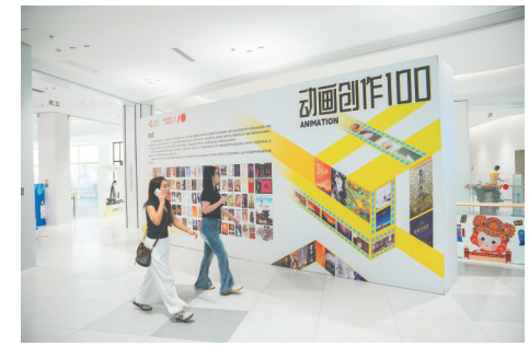
12月4日,市民路过“动画创作100”动画短片作品展。

据介绍,第六届海南岛国际电影节“动画创作100”系列活动中,影迷可以近距离领略100部近年来国产优秀动画短片的独特魅力。这些作品有的将传统文化元素巧妙融入现代动画语言,有的以独特视角展现当代青年的热血梦想与生活百态。此次活动还致力于动画创作者与投资者搭建沟通的桥梁,助力优秀动画IP从创意构思迈向影视化,挖掘更多动画作品背后的无限潜力。同时,借助海南自贸港的政策,推动国产动画IP走向世界舞台,让全球观众都能欣赏到中国动画的魅力风采。