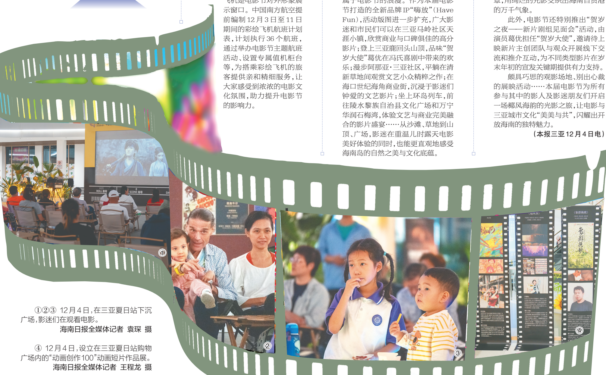
④ 12月4日,设立在三亚夏日站购物广场内的“动画创作100”动画短片作品展。