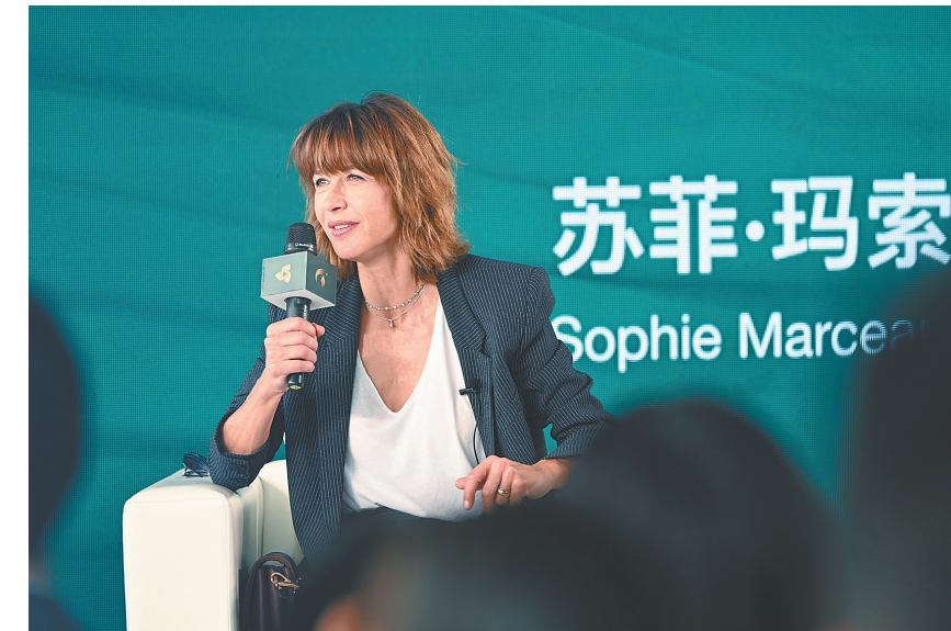
12月5日，苏菲·玛索亮相电影节大师班活动。

如今，数字技术、虚拟现实技术等先进技术的飞速发展对电影创作和观影体验产生很大的影响。但在苏菲·玛索看来，电影是一种创作艺术，技术对电影而言是工具，是一种可以让电影变得更加精