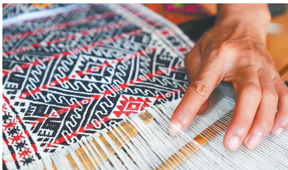
美的黎锦。在织娘灵巧的手下,一根根纱线慢慢织成精美图案。