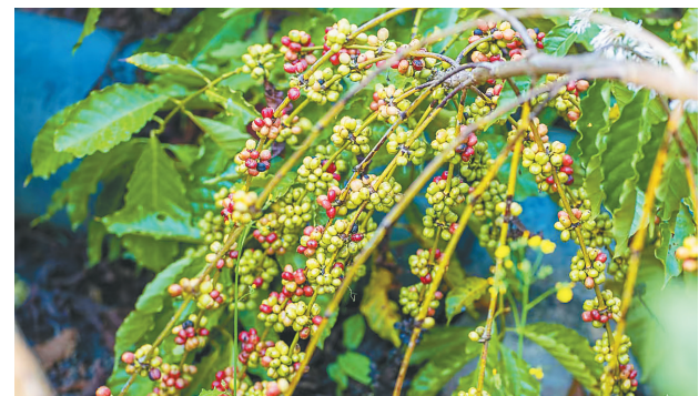
一簇簇咖啡红果满挂枝头。

备安装完成,形成了今天母山咖啡的雏形——大丰咖啡。1992年,大丰科研人员最终确立了以罗布斯塔作为基础种质,进一步培育出海垦“大丰一号”和“大丰二号”中粒种咖啡。