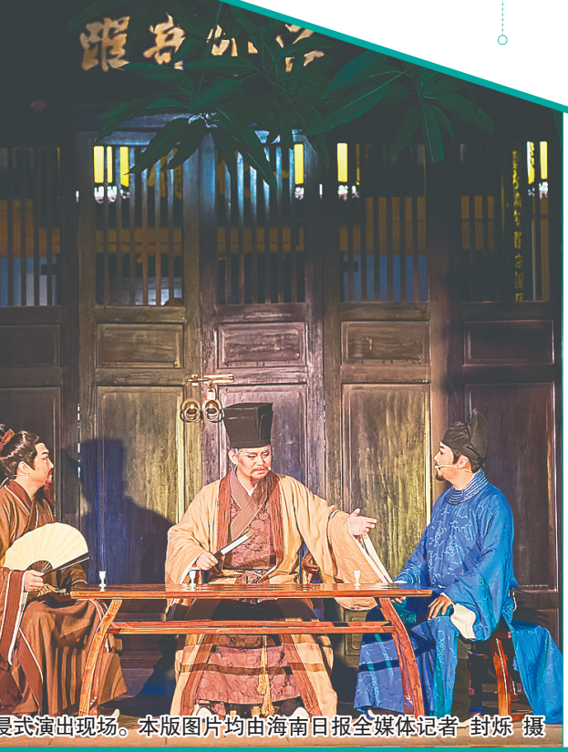
《男神东坡》沉浸式演出现场。