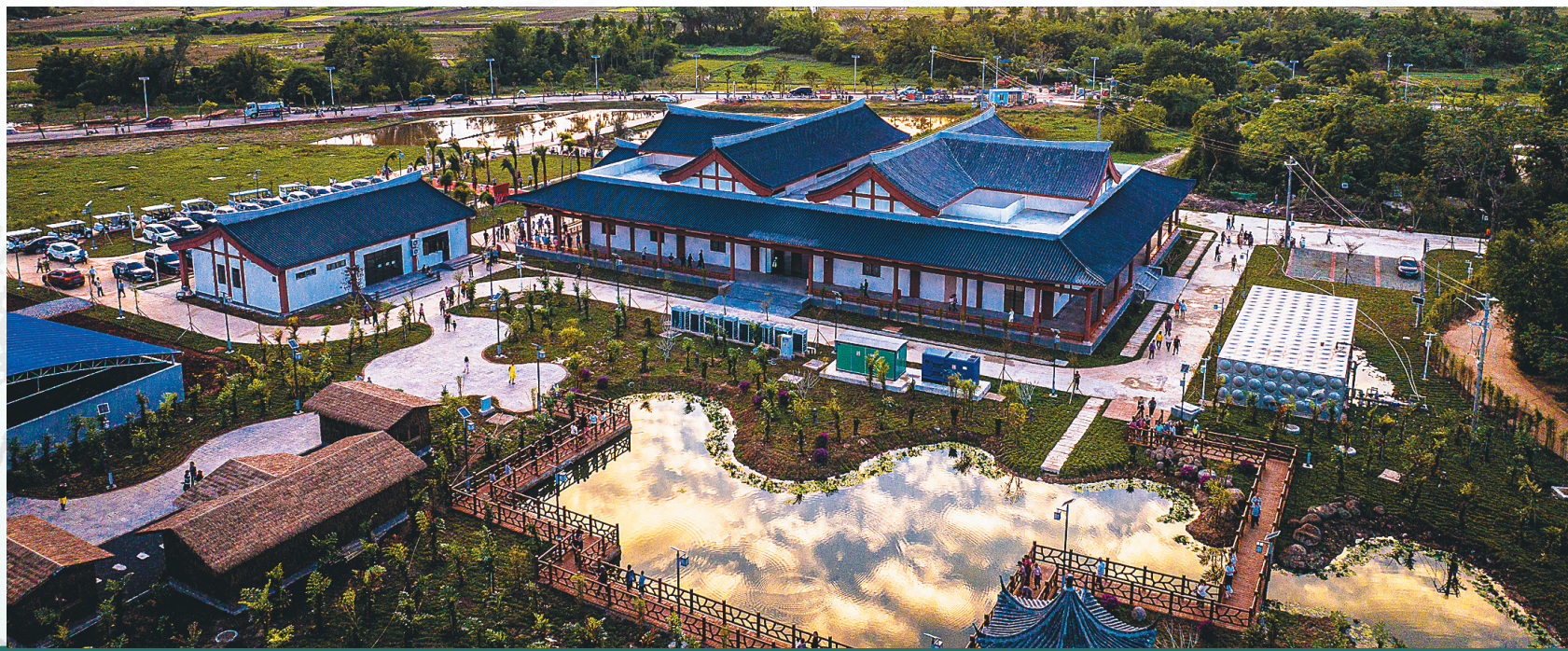
新落成的儋州东坡桄榔庵纪念馆。