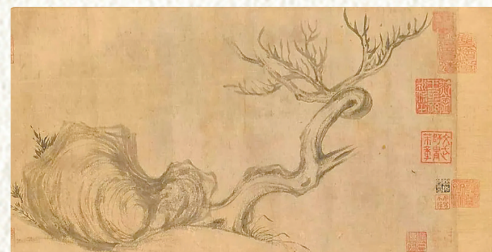
苏轼《枯木怪石图》局部。资料图

除了擅画墨竹，东坡画的枯木也是一绝。《枯木怪石图》中的一株枯木，枝干盘曲偃卧，没有树叶，笔墨疏放简淡，给人一种拙顽枯傲、老劲雄放之感，蕴含了东坡历经沧桑却依然傲兀旷达的人格。宋僧道潜《同趣伯充防御观东坡所画枯木》其二云：“萧然素壁倚枯枝，行路惊嗟况所思。惆怅骑鲸天上去，却来人世恐无期。”（《参寥子集》）宋孙覿又有《题莫寿朋内翰所藏东坡画枯木》《书章邦基藏东坡画枯木》等诗文。不知我们今天看到的《枯木怪石图》是否就在其中。■