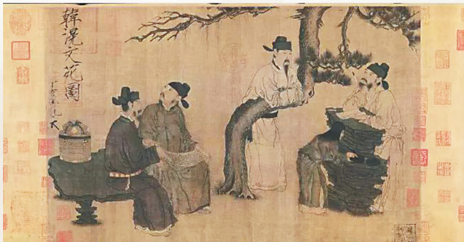
（五代）周文矩《文苑图》，现藏故宫博物院。描绘四位文士赏诗雅集的场景，童子在一旁研墨。中国文人与文房四宝的关系格外紧密。