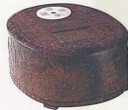
“苏黄”以砚会友的洮河砚。