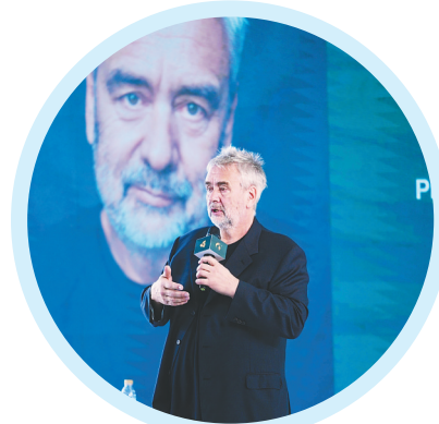
吕克·贝松分享电影创作经历。

它无法完全替代人类的创造力。“或许AI能创作出电影《狗神》的续集,但AI却难以创造出像《狗神》《碧海蓝天》等引发情感共鸣的剧本,因为AI的创作基于现有的内容,它很难再进行创新。”同时,吕克·贝松认为,不必一味地抵制AI,可将其视为工具,而非对手。