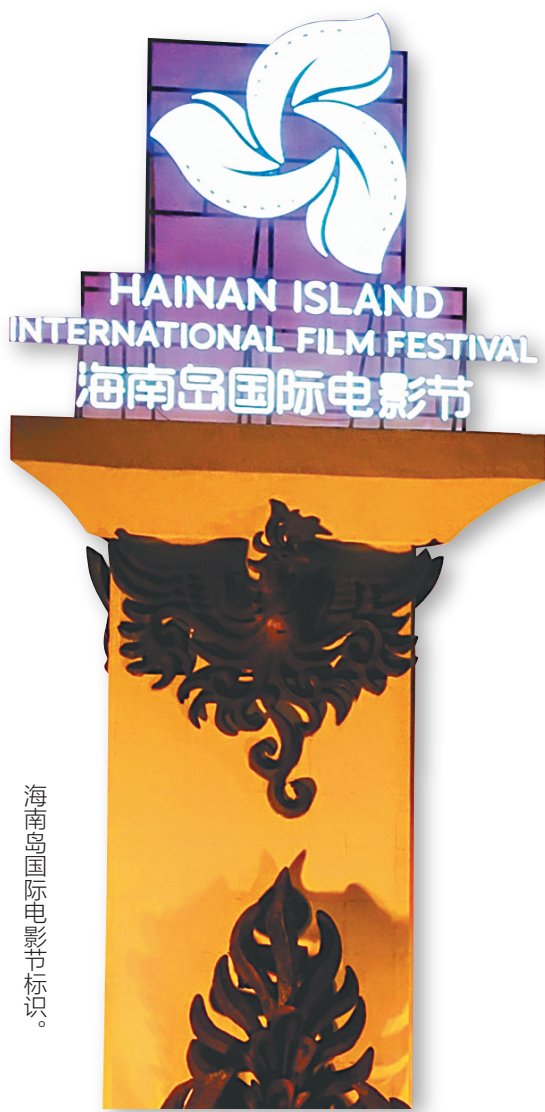
海南岛国际电影节标识。

从紧张刺激的犯罪悬疑,到温情脉脉的家庭故事,从浪漫动人的爱情喜剧,到引人深思的剧情佳作……当冬日的寒风凛冽呼啸,海南岛却宛如一座温暖的港湾,电影节“贺岁之夜”带着满满的热忱,为影迷观众送上这份暖冬贺岁影片大礼的同时,助力佳作传播。