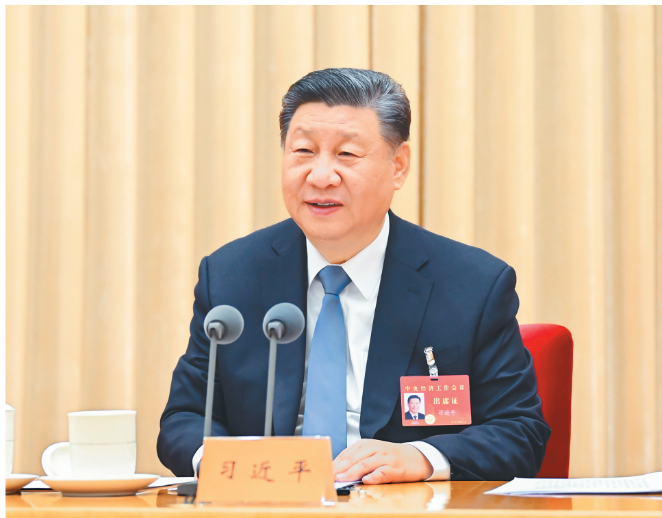
12月11日至12日，中央经济工作会议在北京举行。中共中央总书记、国家主席、中央军委主席习近平出席会议并发表重要讲话。

会议强调，做好明年经济工作，要以习近平新时代中国特色社会主义思想为指导，全面贯彻党的二十届二中全会和二十届三中全会精神，坚持稳中求进工作总基调，完整准确全面贯彻新发展理念，加快构建新发展格局，扎实推动高质量发展，进一步全面深化改革，扩大高水平对外开放，建设现代化产业体系，更好统筹发展和安全，实施更加积极有为的宏观政策，扩大国内需求，推动科技创新