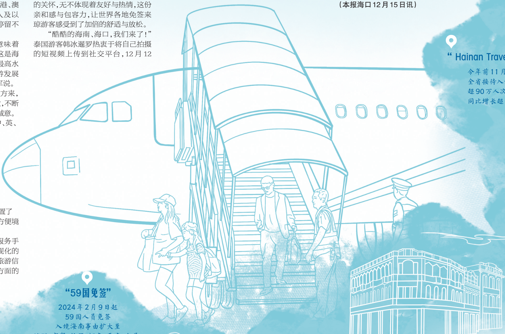
手绘：杨千懿 陈海冰