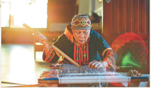
黎族传统纺织染绣技艺国家级传承人容亚美。