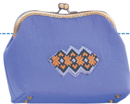
带有黎锦纹样的包。