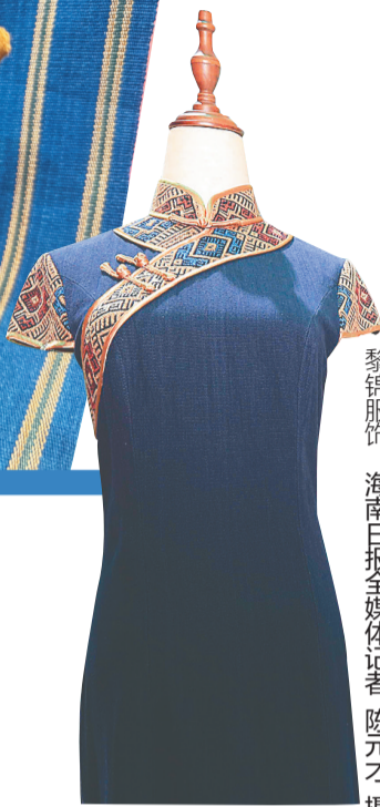
黎锦服饰。

当古老和新潮相遇，会碰撞出什么样的火花。近年来，黎锦宛如一颗历经岁月洗礼的明珠，散发出耀眼的光芒。它不再只是博物馆中的珍藏，而是以潮流之姿走向大众、融入生活。