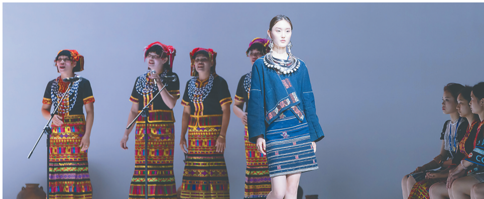
2023消博会时装周闭幕式上，模特穿黎族服饰走秀。