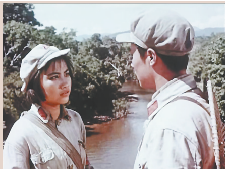
电影《红色娘子军》剧照。